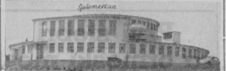
Nova vinska klet v Ljutomeru

je zbralo več tisoč udeležencev, med njimi predstavniki občin Pomurja, republiški in zvezni poslanci, namestnik republiškega sekretarja za gospodarstvo, nekateri člani IS SRS ter iz-