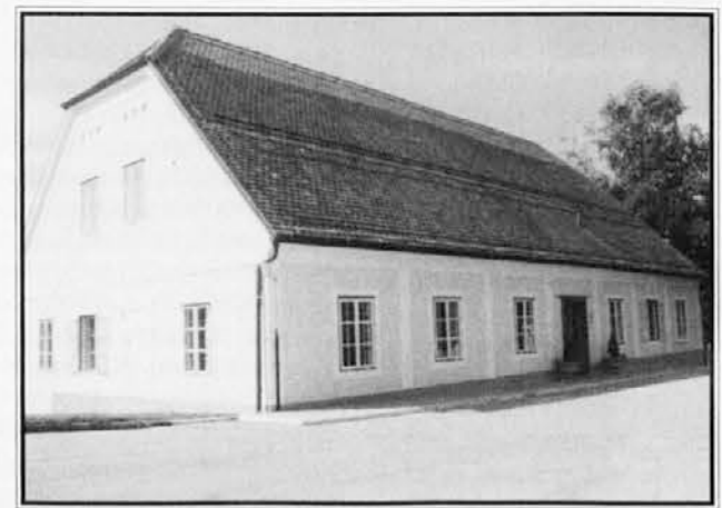
Obnovljena Slomškova rojstna hiša na Slomu pri Ponikvi. Levo zgoraj: portret blaženega v župnijski cerkvi na Ponikvi

Zdaj je pred nami slovesna razglasitev škofa Slomška za blaženega, in sicer 19. septembra v Mariboru.