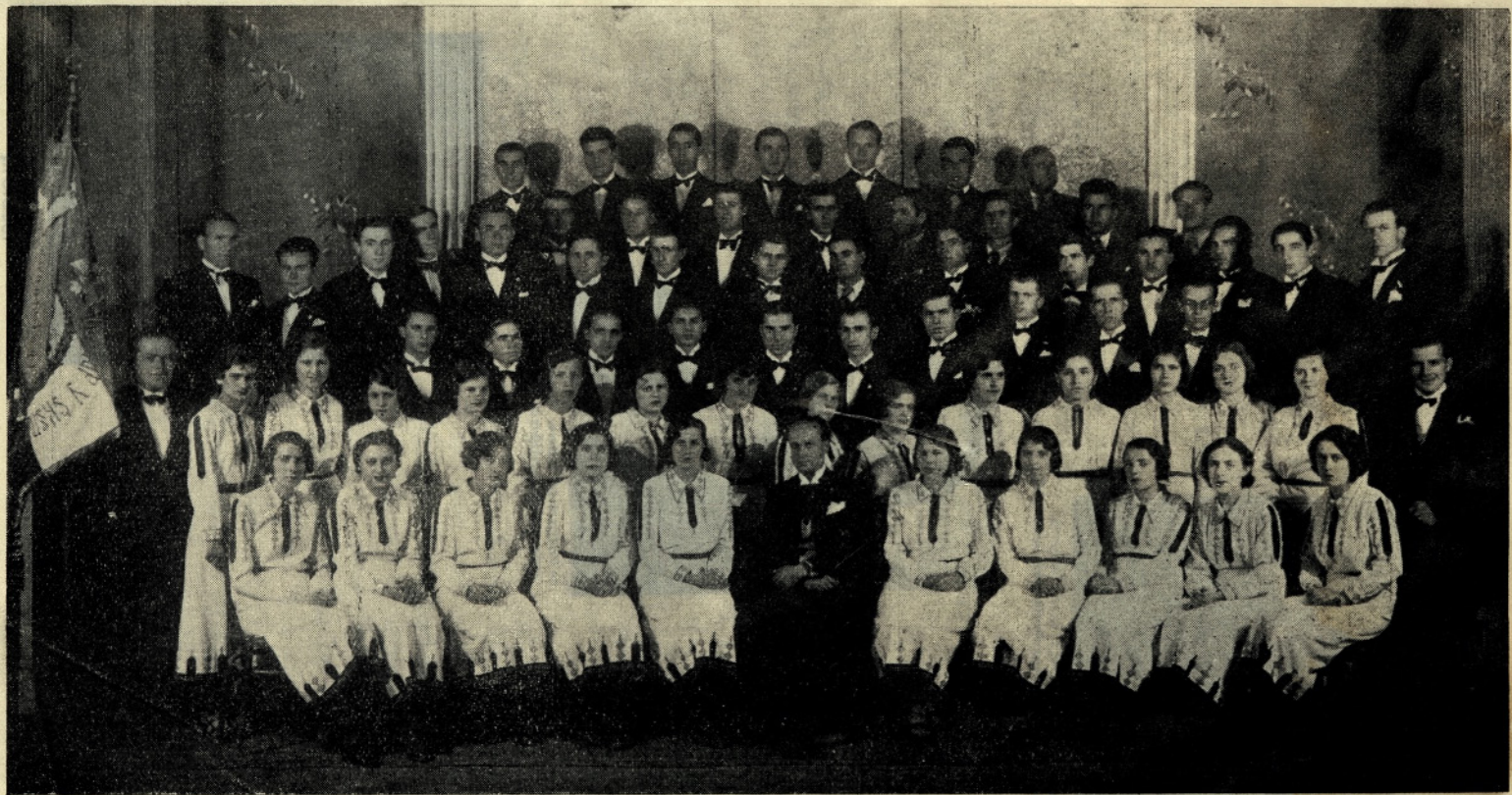
Hor Pevačkog Društva „Vardar“