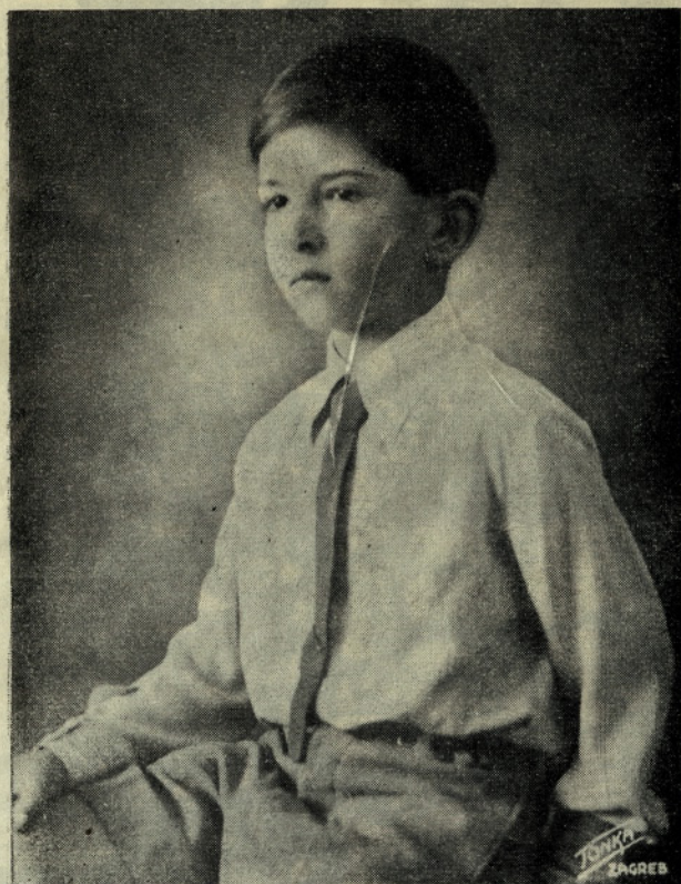
Zaštitnik Društva Nj. Kr. Visočanstvo PRESTOLONASLEDNIK PETAR