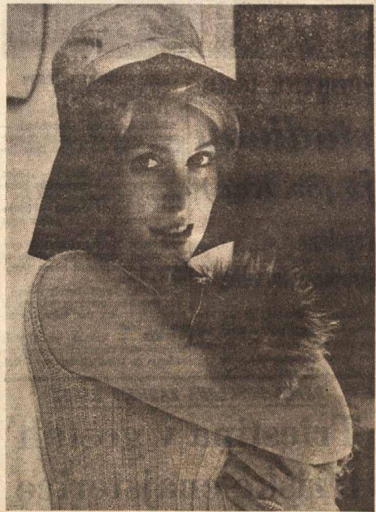
Slika nam kaže francosko filmsko igralko Catherine Daneu na njenem domu v Parizu. K njenemu slovesu je pripomogel predvsem režiser Bunuel s filmom «Belle de jour», ki je prejel na beneskem festivalu prvo nagrado. Sedaj nastopa igralka v novem filmu v vlogi Manon, seveda modernizirani

Seveda bodo jezero še podrobneje raziskali. Ta prva odprava je le nekak uvod, ki pa je rodil bogate sadove.