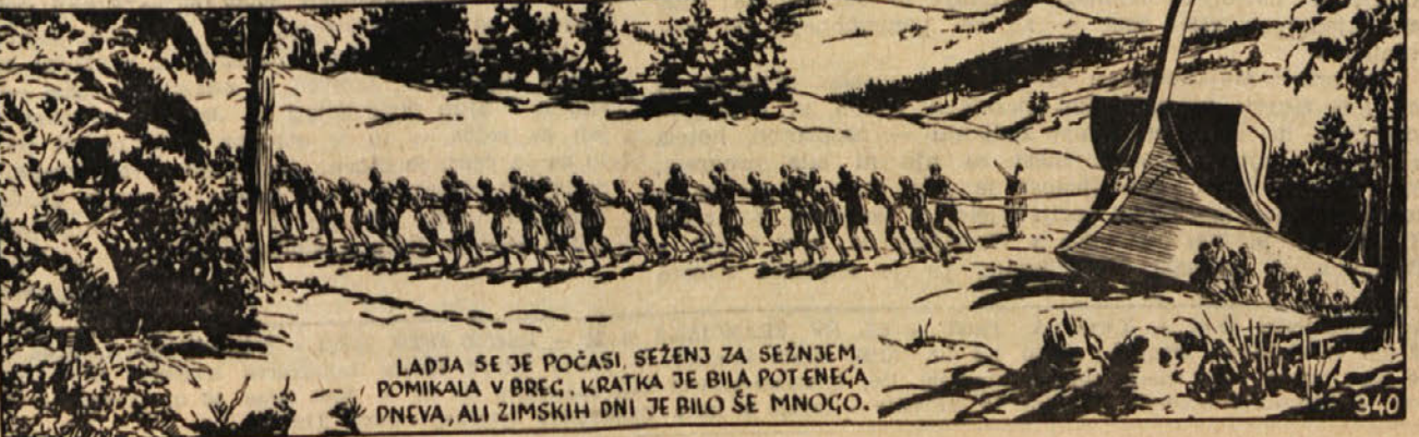
LADJA SE JE POČASI SEŽENJ ZA SEŽNEM. POMIKALA V BREG, KRATKA JE BILA POT ENEGA DNEVA, ALI ZIMSKIH DNI JE BILO ŠE MNOGO.