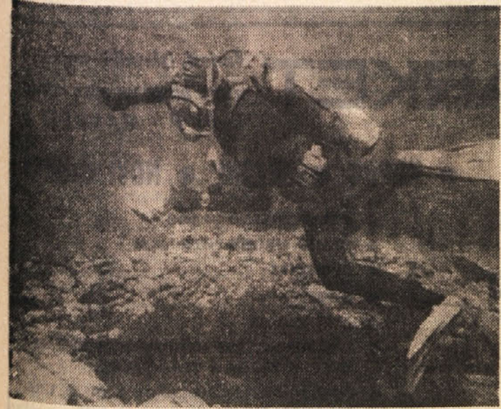
Na sliki vidimo argentinskega diplomata, ki plava med podrtinami inkovskega mesta

Zidovi v dolžini enega kilometra in ohranjena tlakovana cesta - Ali gre za templje, ali za veliko nekropolo? - Arheologi in strokovnjaki so še negotovi