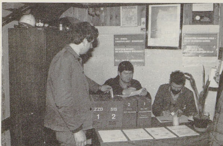
Volišče v TOZD Transport.