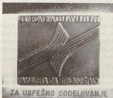
Priznanje, ki nam ga je dodelila Fakulteta za strojništvo

V 18. letih sodelovanja s FS na RR področju je bilo izdelanih nad 35 raziskovalnih nalog z navedenih in še drugih področij proizvodnega