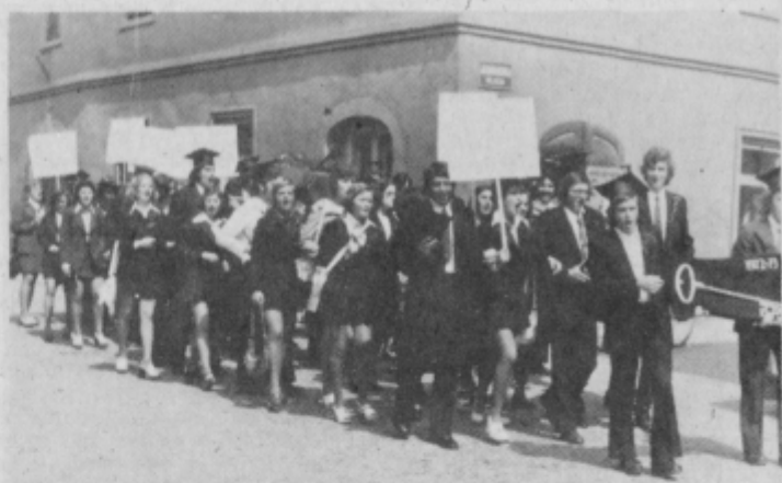
Rešeni smo, je pisalo na transparentih, ki so jih nosili četrtošolci ptujске gimnazije.