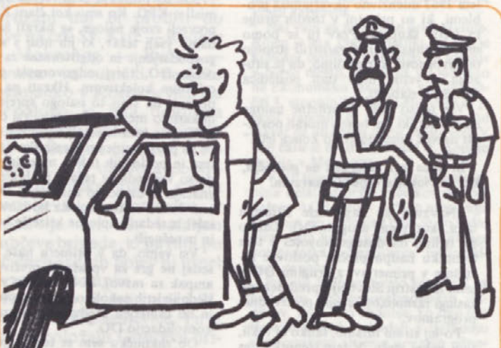
Resnično so me razburili s tem alkotestom. — Brž sem s to steklenico žganjal