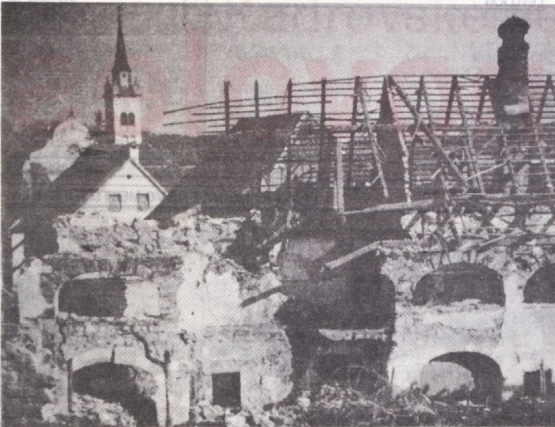
SEPTEMBER 1943 - Novo mesto po nemškem bombardiranju