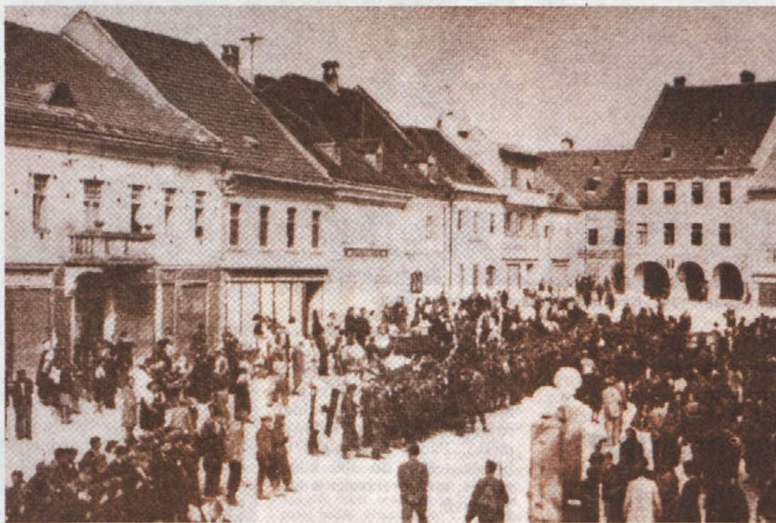
OB KAPITULACIJI ITALIJE — Alandrova brigada na Glavnem trgu

9. septembra 1943 zjutraj je prišel v Novo mesto na poga-