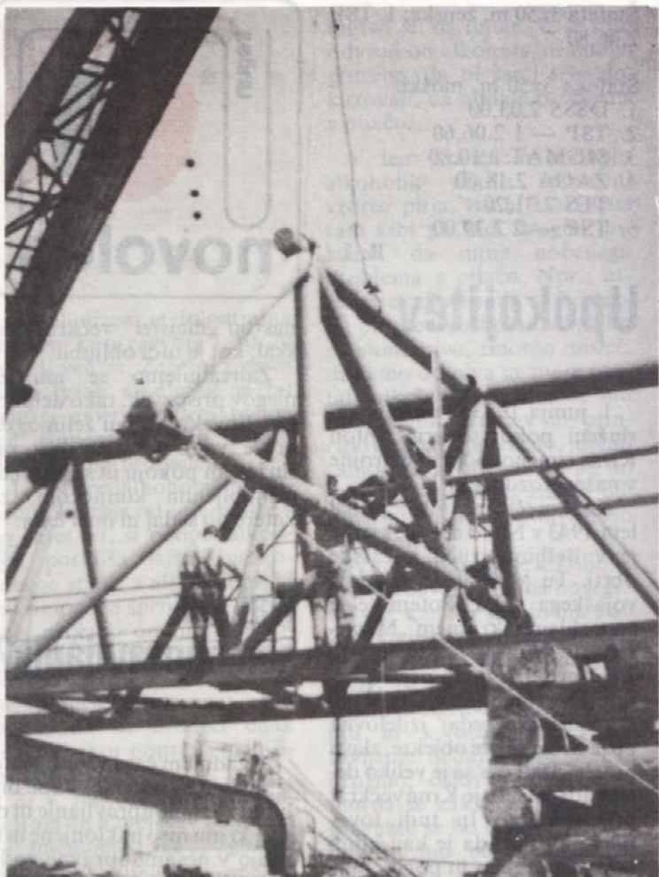
Montaža žerjava v TVP se nadaljuje