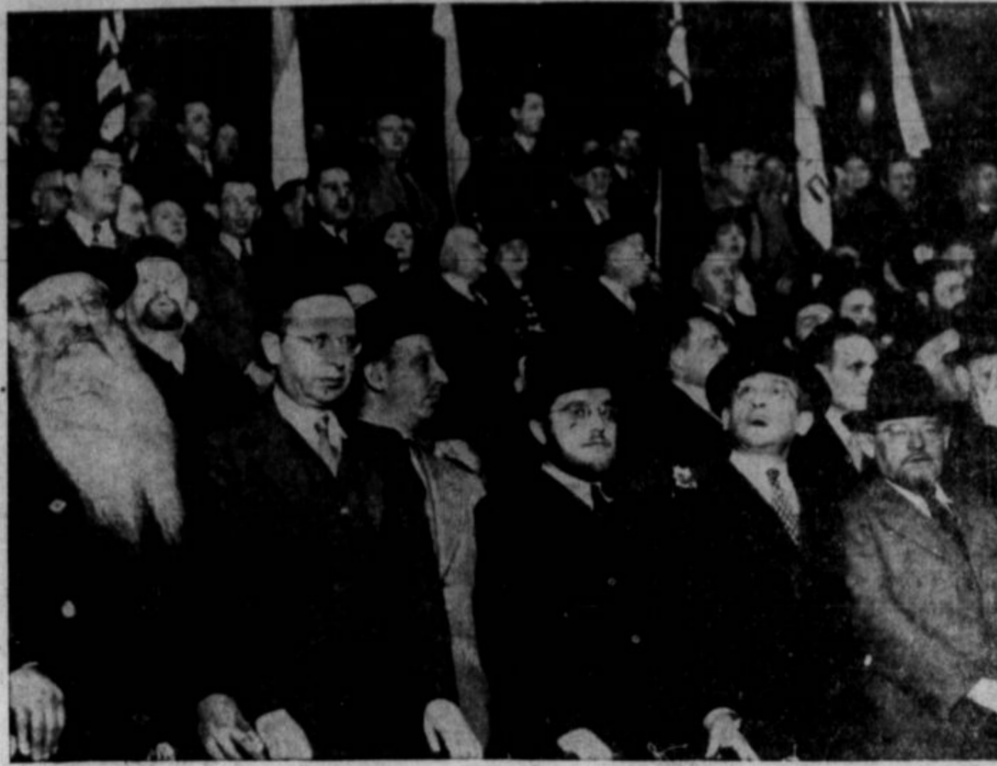
AMERIŠKI ZIDJE so privedli proti Angliji že mnogo protestnih shodov, ker se protivi odpreti meje Palestine Zidom v Evropi, ki nimajo kam drugam iti. Gornje je slika iz židovskega protestnega shoda v Chicagu. V ospredju so rabiji, ki najbolj delujejo, da bi se Palestino spet spremenilo v židovsko državo.

Med vojno smo večkrat čuli od tistih, "ki so več vedeli", ko smo se prekljali zaradi bratomornega boja v Sloveniji, da je tam še neka druga močna, pošena srednja stranka ali struja, med Titovo partizansko strujo in med nazadnjaško skupino, ki jo je organiziral okupator in "požegal" škof Rožman, da kolje svoje brate za sveto vero in srbsko čaršijo. Ampak čimdalje je bolj jasno, da tiste srednje močne skupine nikjer ni in je tudi ni bilo za časa vojne. Vsa poročila kažejo, da so bili vsi