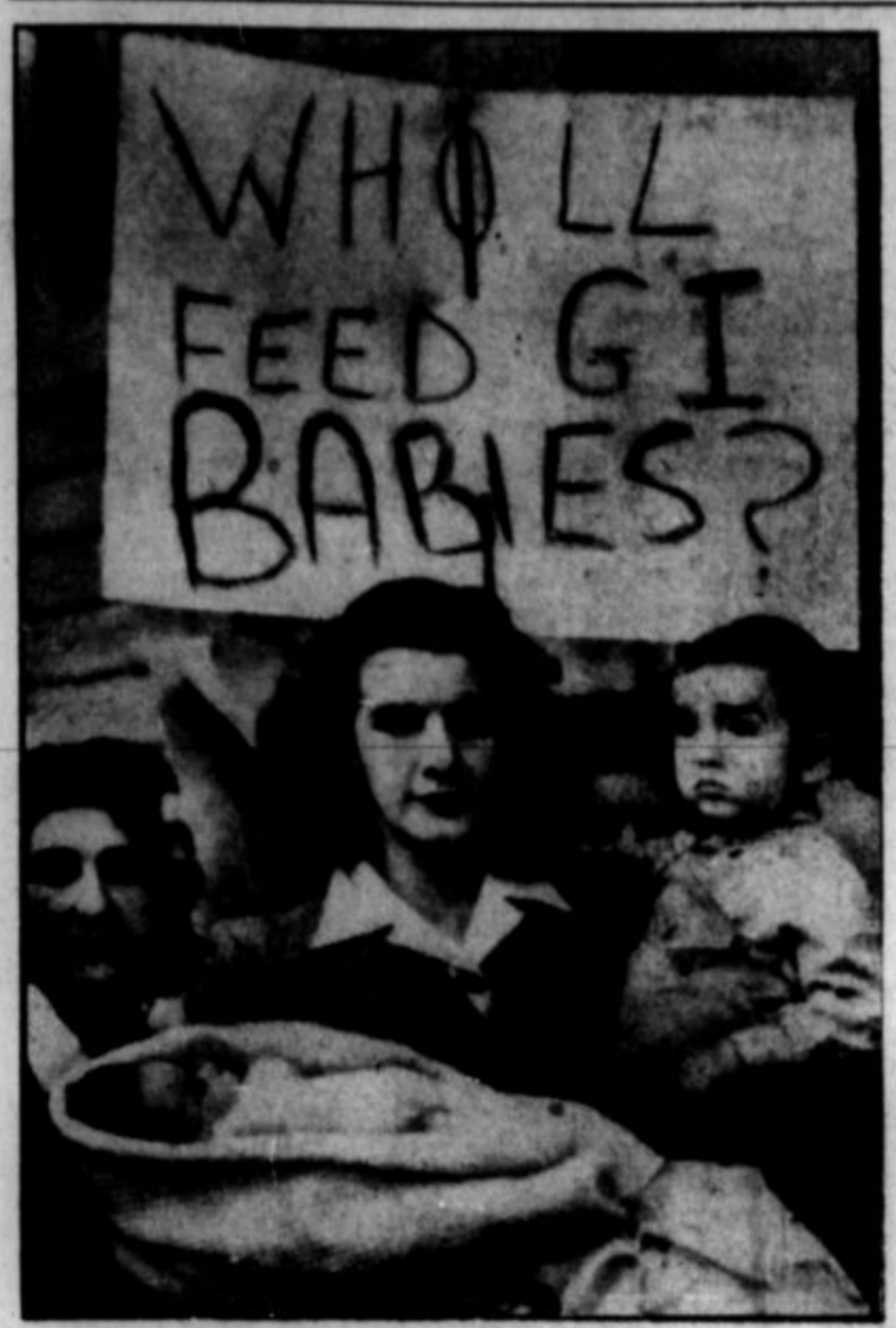
AMERIŠKI VOJAKI bodo privedli domov ne samo veliko nevest pač pa tudi naraščajo. Na tisoče otrok imajo v Angliji, kmalu jih bo več kot na tisoče tudi v Nemčiji, pa jih je tudi drugje. Kajti "natura je natura". Gornje je slika iz demonstracije nevest naših fantov, ki so se oženili v Londonu. Žene bi rade prišle sem, pa jim ne dajo viz, ne prostora tako hitro, kakor bi one rade. In svojo pravico dokazujejo z naraščanjem.