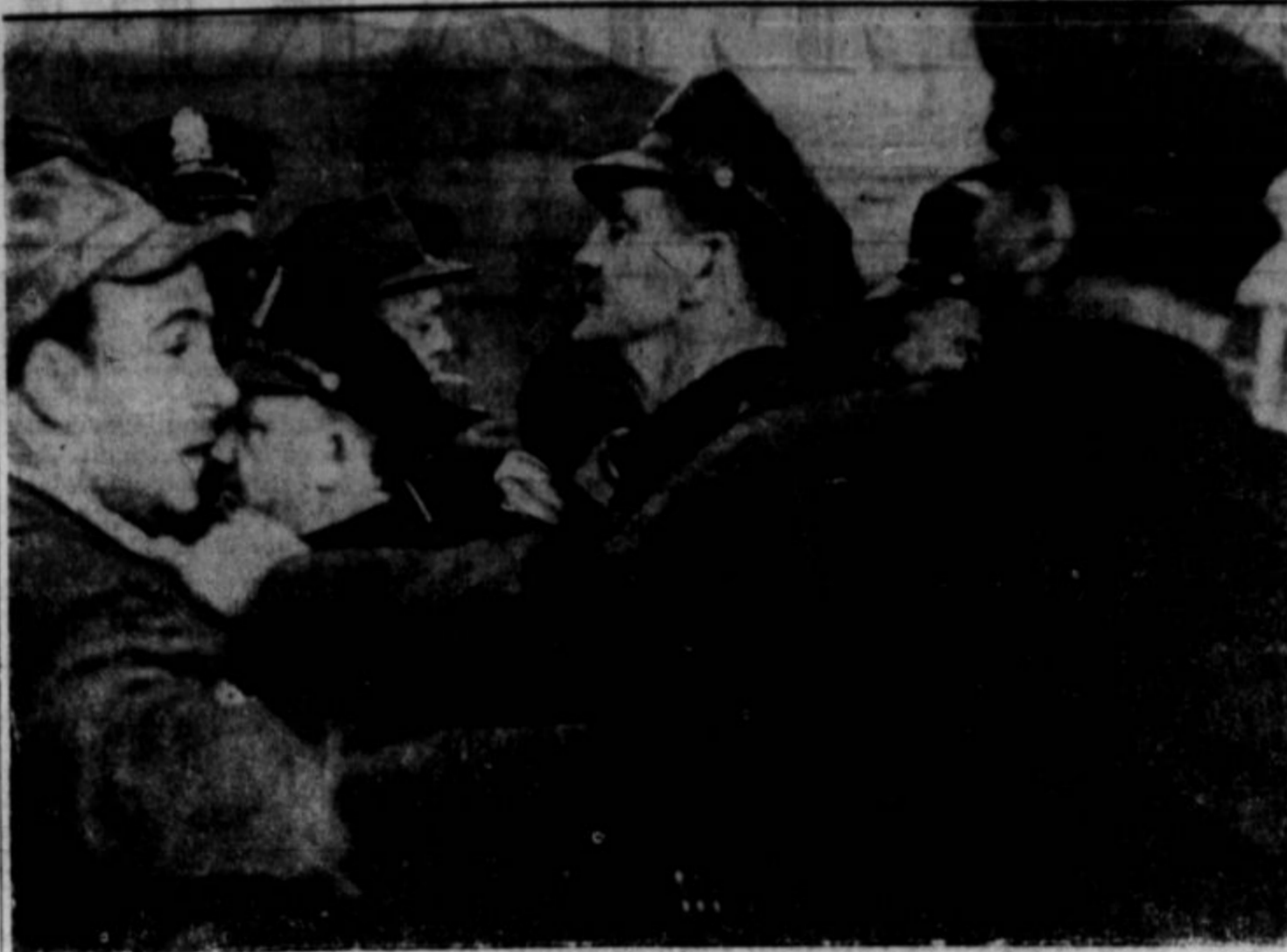
PREJ SPOPADI NA FRONTAH, sedaj v stavkah, ker se povračamo v "normalne razmere". Gornje je prizor pred neko tovarno v Philadelphiji.

Po tradicijah bi moral postati titularni vodja demokratske stranke v Wisconsinu Daniel W. Hoan, ker je bil leta 1944 njen