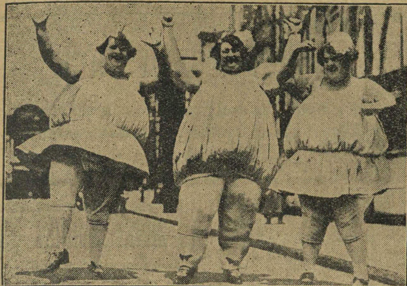
Tři vdavekchtivé gracie, — kdo si z vás troufá?

VÝBOR DĚLNICKÉHO SDRUŽENÍ svolává na neděli dne 31. října 1926 na 3 hod odpoledne do restaurantu na ulici Belgrano (centro) 861 mimořádnou valnou hromadu o následujícím pořadem: