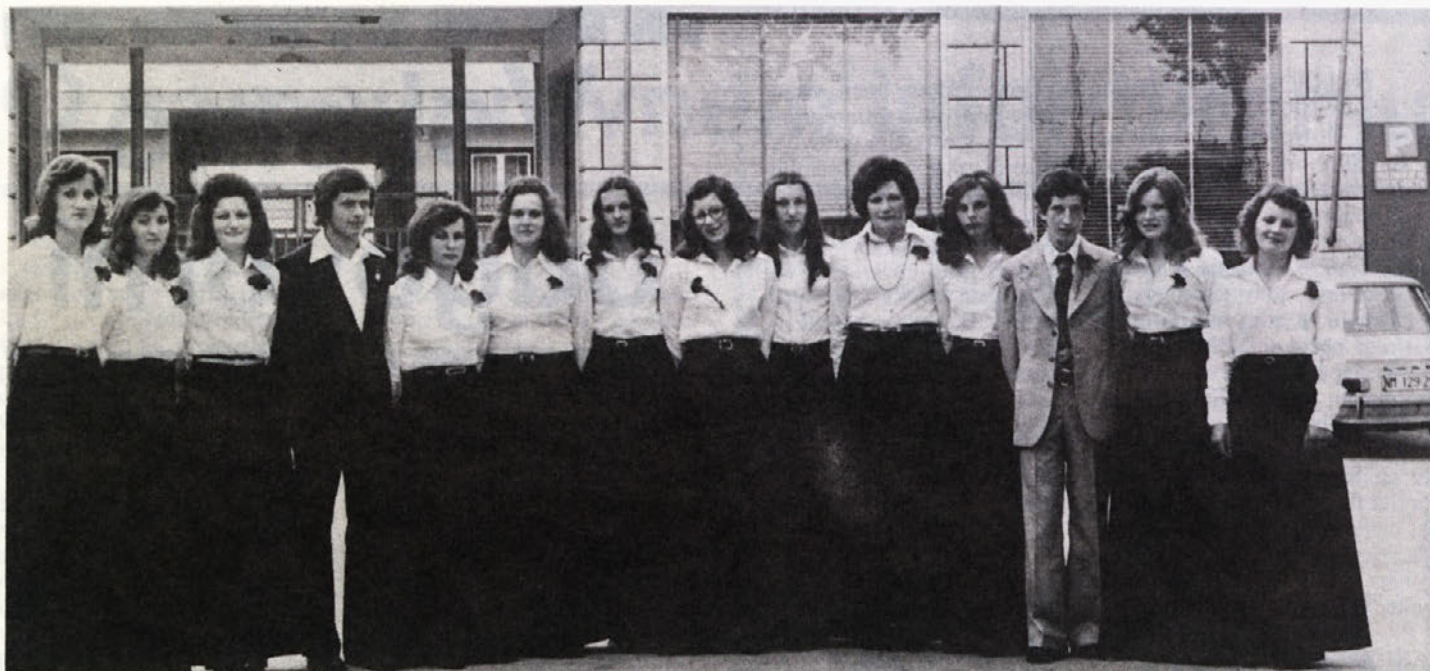
Izobraževanju posvečamo v BETI veliko pozornost. Konec maja je zapustila poklicno šolo nova generacija učenk in učencev. Pri delu in življenju jim želimo mnogo uspeha!