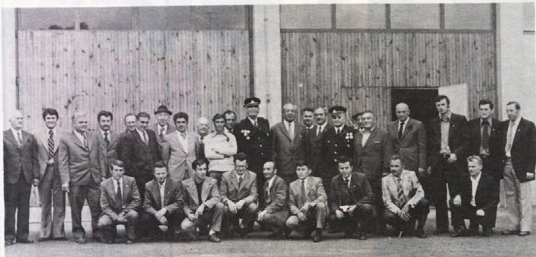
Metliške gasilce so obiskali kolegi iz Kragujevca. Skupno so preziveli lep dan, pogovorili pa so se o svojih težavah in uspehih.