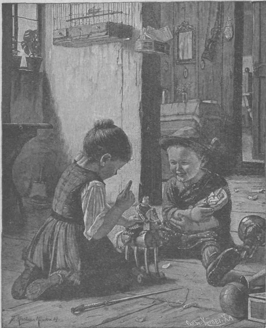
Pri igračah. V zalogi „Fotogr. Unije“ v Monakovem.

splavala po vodi. Pod milim Bogom ni imel sorodnika, ne znanca, ki bi mu bil pomoč na tem razpotju. Dasi so poznali trgovci v Dolini in okolici njegovo poštenost, ni ga hotel nihče vabiti k sebi, Petran se pa ni upal nikomur ponujati.