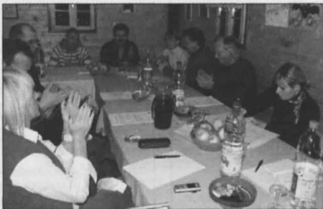
Z zbora članov KD Leskovec

Pregled delovanja društva je pokazal, da so bili v letu 2007 med najbolj ustvarjalnimi leskovški gledališčniki. Dramska skupina je s komedijo »Dohodnina« gostovala po različnih krajih Slovenije, otroška gledališka skupina, ki si je nadela umetniško ime »In kako naprej?«, pa je s svojimi »Skrivnostmi iz šolskega veceja« seznanjala obiskovalce po bližnji okoli-