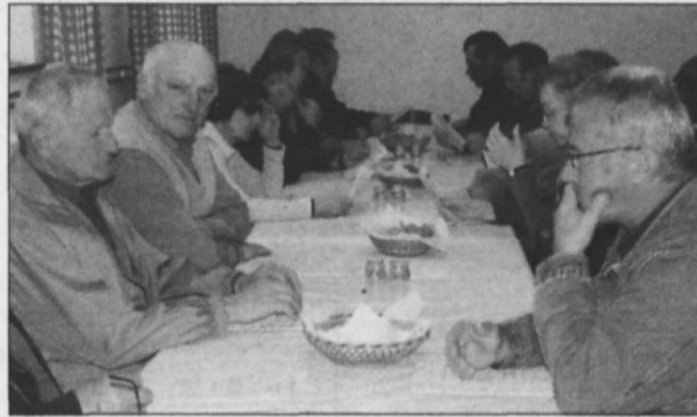
Senovski upokojujenci med zborom

kjer ima DU sedež že od leta 1972 in so ga v društvu ne glede na to, da je bilo v objektu več koristnikov, edini tudi redno vzdrževali. Vloga, ki so jo