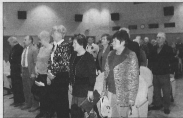
Minuta molka v spomin dr. Janezu Drnovšku.