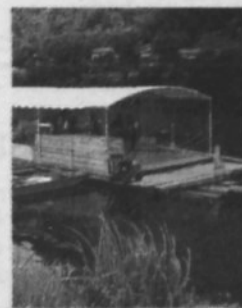
SPLAVARJENJE V RADEČAH:

V Radečah se lahko poročite tudi na splavu