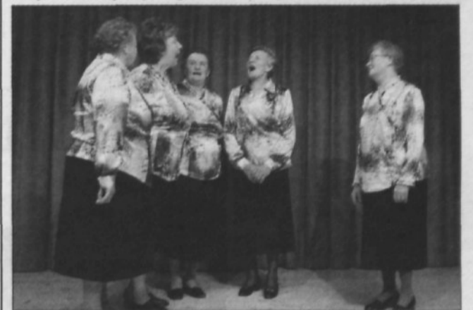
Ljudske pevke z Razborja