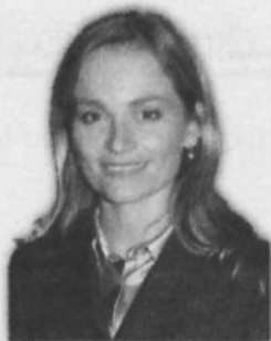
KATARINA KRESAL, predsednica LDS:

»Razvoju slovenske politike bi koristilo več ženske note«