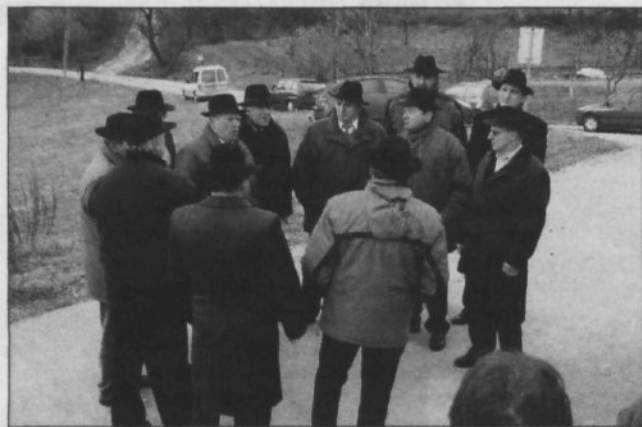
Sromeljski pevci ob enem izmed nastopov