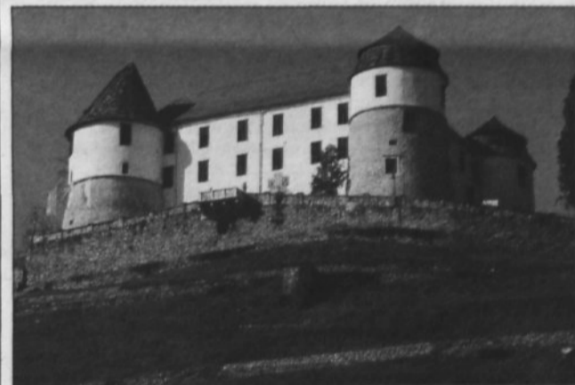
Eden od objektov, s katerimi upravlja zavod KŠTM, je tudi sevniški grad.

Zavod KŠTM skrbi za vzdrževanje Ajdovskega gradca, gradu Sevnica z Lutrovske kletje, grajskim gozdom, parkom in vinnogradom, grajsko kavarno in prireditve na gradu, za vzdr-