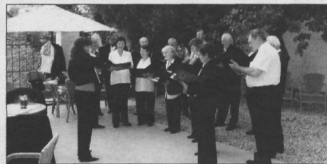
Dobovski zbor med lanskoletnim nastopom v Mestnem atriju Brežice

na državno srečanje ljudskih skupnosti, kar seveda pomeni promocijo tako celotnega društva kot posameznih sek-