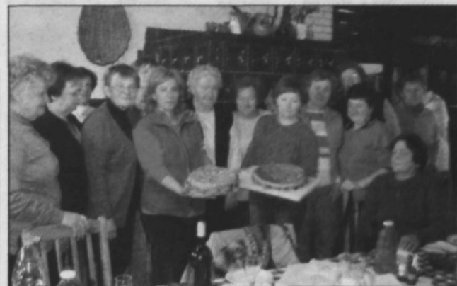
Članice DK Brežice na tečaju priprave mlinčevke na Bizeljskem

BREŽICE - Članice Društva kmetič Brežice se združujejo v društvu že dobrih trideset let in so organizirane po aktivnih po vseh krajevnih skupnostih brežiške občine. Rade se udeležujejo družabnih srečanj, izletov, pa tudi poučnih vsebin, še zlasti kuharskih tečajev. Letošnjo zimo smo obujale ku-