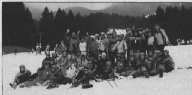
Skupinska slika udeležencev zimovanja

SREDNJI VRH, KRŠKO - Krška Zveza prijateljev mladine je za 30 socialno ogroženih otrok iz Posavja v času zimskih počitnic pripravila prijetne trenutke, ki so se odvijali na Srednjem Vrhu nad Gozdom Martuljek. Spremljali so jih prostovoljci ter učitelja smučanja, saj so se spuščali po zasneženih planjavah Koble ter tudi na Planici, kjer so si ogledali skakalnico velikanko. V počitniškem domu pa so si krajšali čas z Zmenkarijami, izvedli so turnir v