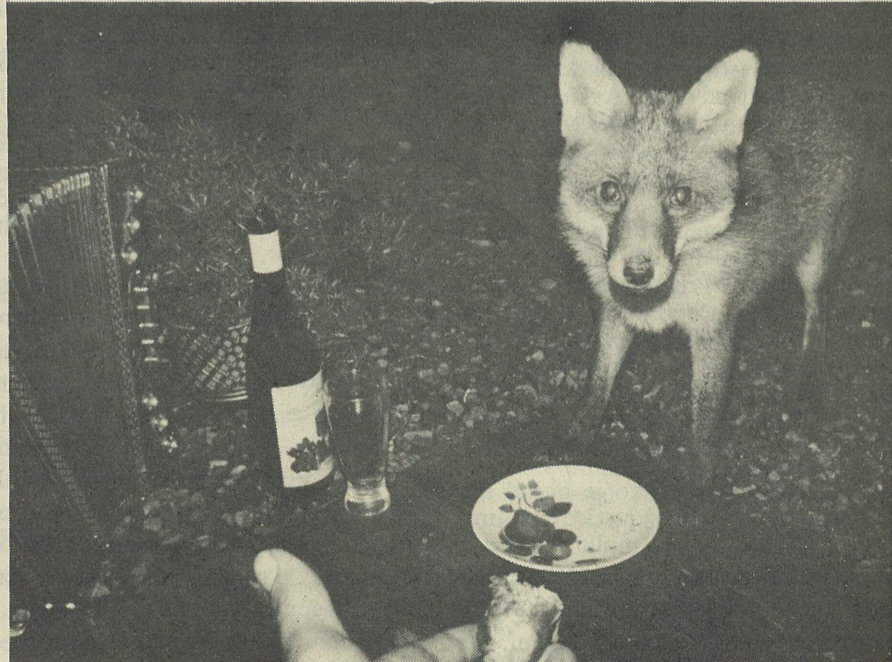
Lisička, naš stalni prebivalec na hribu v Elthamu, tudi prihaja na veselice