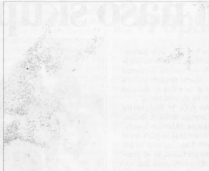
Il recupero del ricovero militare sul Gran Monte

Molte opere sono state realizzate nell'ambito della viabilità, importantissima per Taipana, si è inoltre badato a sanare altre opere pubbliche, "bonificare" il territorio, ripristinare sentieri, creare il parco del Gran Monte e recuperare il ricovero militare,