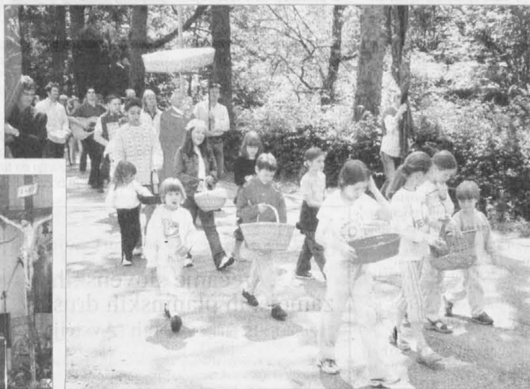
Gor na varh precesija po vasi. Tle par kraj vasnjani z Barc na Liesah

Takuo, ki če druga stara navada, tisti dan po Majenci, v pandiejak 31. maja, so va-