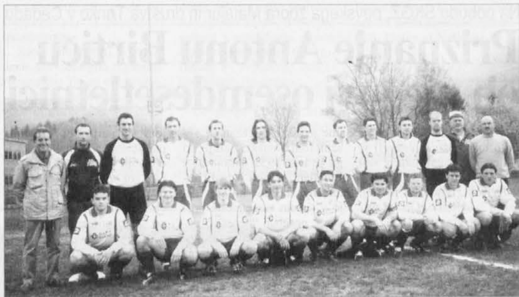
La squadra maggiore che ha giocato nel campionato dilettanti di 3. Categoria

Con il Torneo dei Pulcini, organizzato dall'Audace di S. Leonardo per domenica 13 giugno in occasione dei quaranta anni di fondazione della società, si concluderà la stagione calcistica 2003/04 delle nostre squadre.