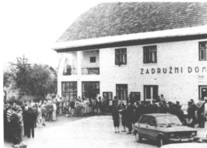
Udeležence je sprejel prenovljeni prosvetni dom