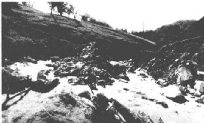
Grozečo strujo si je izdolbla voda. Koliko plazov bo še tod, se še ne ve, bo pa potrebnih veliko škarp.