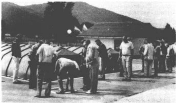
Pričetka delovanja čistilne naprave v Lokah so se udeležili vsi, ki so sodelovali in prispevali k njeni izgradnji

V sredo so v Lokah pri Mozirju pripravili priložnostno slovesnost ob pričetku delovanja sistema kanalizacijskih zbiralnikov in čistilne naprave. Sistem zbiralnikov povezuje krajevne skupnosti Rečica, Nazarje in Mozirje. To je posebej pomembno zaradi dejstva, ker je v teh treh krajevnih skupnostih kar 80 odstotkov industrije in 60 odstotkov vseh prebivalcev občine Mozirje. V občini se že dolgo zavedajo svoje odgovornosti do mlajših rodov, zato so idejni projekt zasnovali leta 1980 in leto kasneje pričeli z etapno izgradnjo kolektorja od Nazarij do Mozirja. Lani so se lotili še izgradnje čistilne naprave v Lokah pri Mozirju, se pravi njene prve faze z zmogljivostjo 2.000 enot. Kolektorski sistem je bil izdelan po projekti Podjetja za urejanje voda Nivo Celje, zatem pa so se po mnogih ogledih podobnih čistilnih naprav po Sloveniji in po strokovnih posvetovanjih odločili za sistem BIO DISK, ki ga je ponudila delovna organizacija TEH PROJEKT z