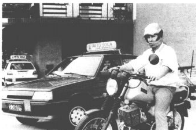
Motorno kolo opremljeno z radijsko zvezo, v ozadju pa avtomobil, v katerem je radijska postaja

Za še uspešnejše in lažje poučevanje praktičnega pouka so si pri avto-šoli ZŠAM omislili novost, ki je redkost pri tovrstnem učenju. V dve osebni vozili so namreč vgradili radijski postaji, ki sta med seboj povezani, povezani pa tudi s postajo, montirano na motornem kolesu. Takoj, ko kandidat sede na motorno kolo in si nadene zaščitno čelado v kateri so slušalke, je preko brez-