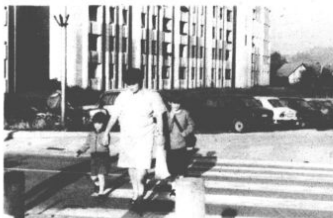
Naj bo prečkanje ceste vse leto varno

metnih znakov, sledi odvzem prednosti, vožnja brez zaščitne čelade, neuporaba varnostnega pasu, pri pešcih pa hoja skozi rdečo luč na semaforju, mimo prehoda za pešce in tako naprej. Se na eno pomanjkljivost velja opozoriti. V prvih šolskih dneh, ko so starši malčke za roko vodili v šolo, ni bilo malo primerov, ko so cesto prečkali — in se tako izpostavili nevarnosti — mimo prehodov za pešce, pa čeprav so bili ti zelo blizu. Pa se sprašujemo, kako bo tak šolar upošteval prehod, če mu starši ne pokažejo kje se pravilno hodi čez ce-