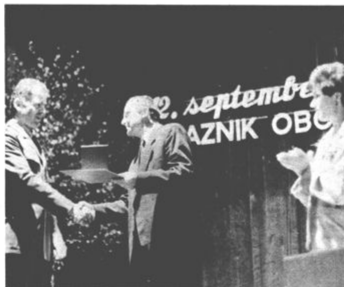
Visoko in zaslužno priznanje obmejni enoti JLA