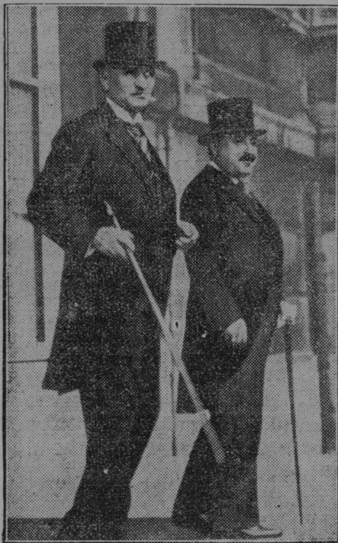
Zunanji minister Jugoslavije Jevtič (desno) v Parizu.