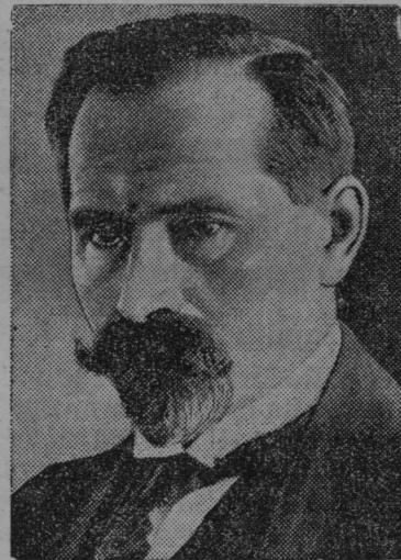
K ponesrečenemu puču v Litvi: Woldemaras (levo), kateremu ni uspel prevrat. Smetona (desno), ki je prekrizal prevratne nakane.