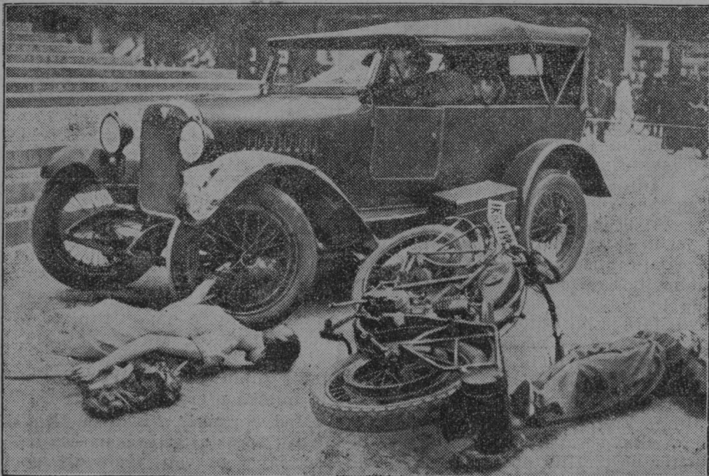
V Nemčiji so priredili prometno-vzgojni teden. V mestu Breslau so kazala avtomobilistom svarilni vzgled pčenagle vožnje.