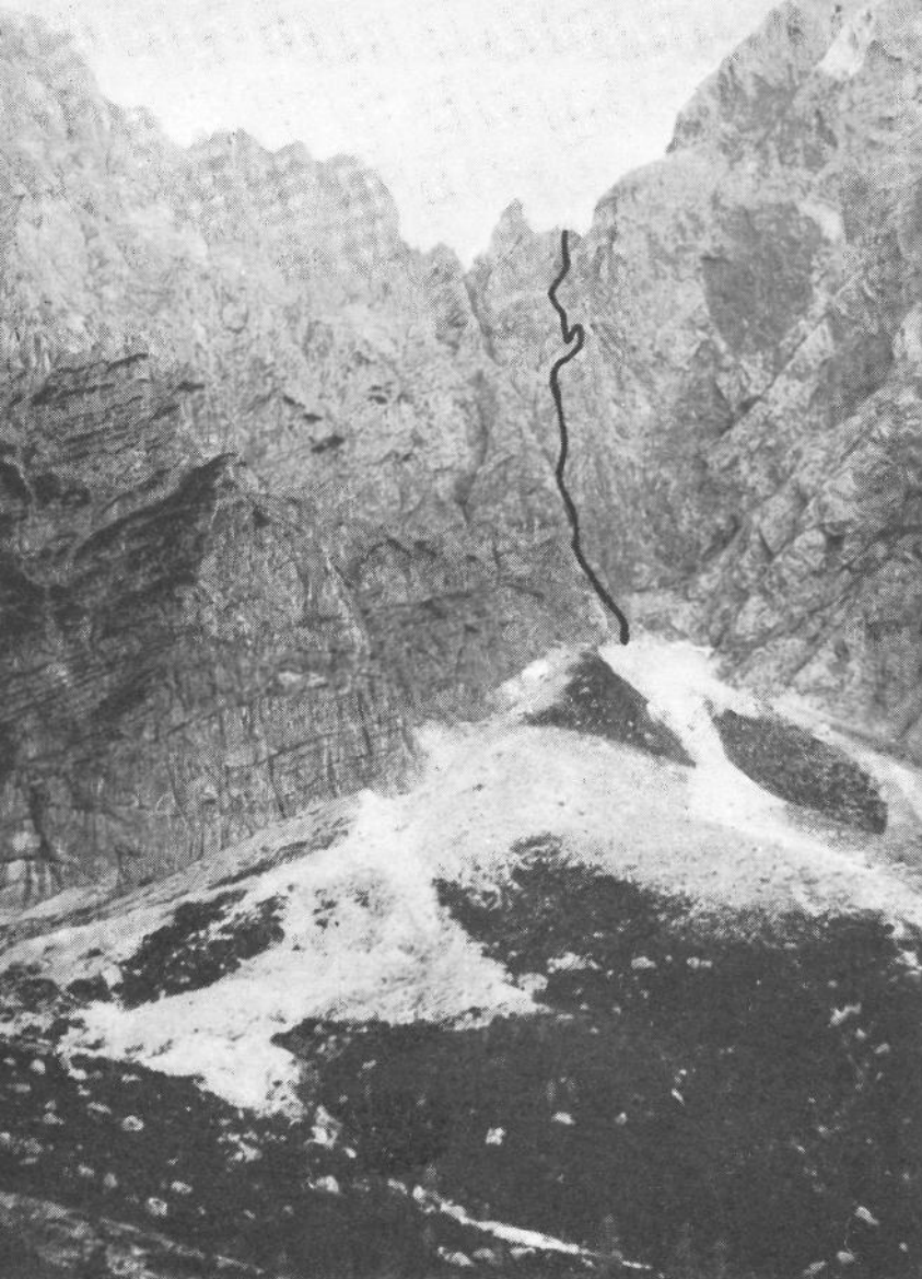
Skrbina v Zadnjem Prisojniku (1955 m), ki jo mnogi imenujejo Mlinarica. (Gl. Naš alpinizem 1932, str. 118)

tudi znam imenovati. Ta imena so me včasih spominjala na daljne, nedostopne kraje. Danes postajajo moja last in zvoki njih imen mi vzbujajo prijetna čustva. Doli na severovzhodu se veriga pretrga. Sklepa jo zelena dolina Krnice, v katero niže doli priteka mrzla Pišnica.