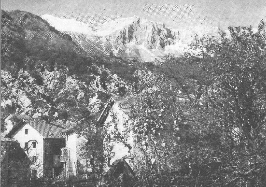
Motiv iz Krnskega pogorja