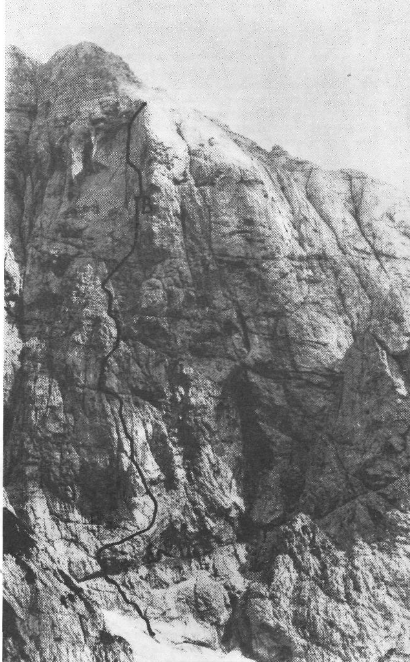
Smer »Mansarda« v Planji. B - bivak prvih plezalcev Krivica in Cedilnika