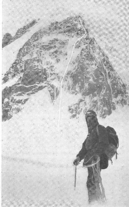
Contaminova smer v Mt. Blanc du Tacul

obzorje valovi kot megleni kotel, ki ga besno meša divji sever. To pa je le znamenje bližajočega se izboljšanja.