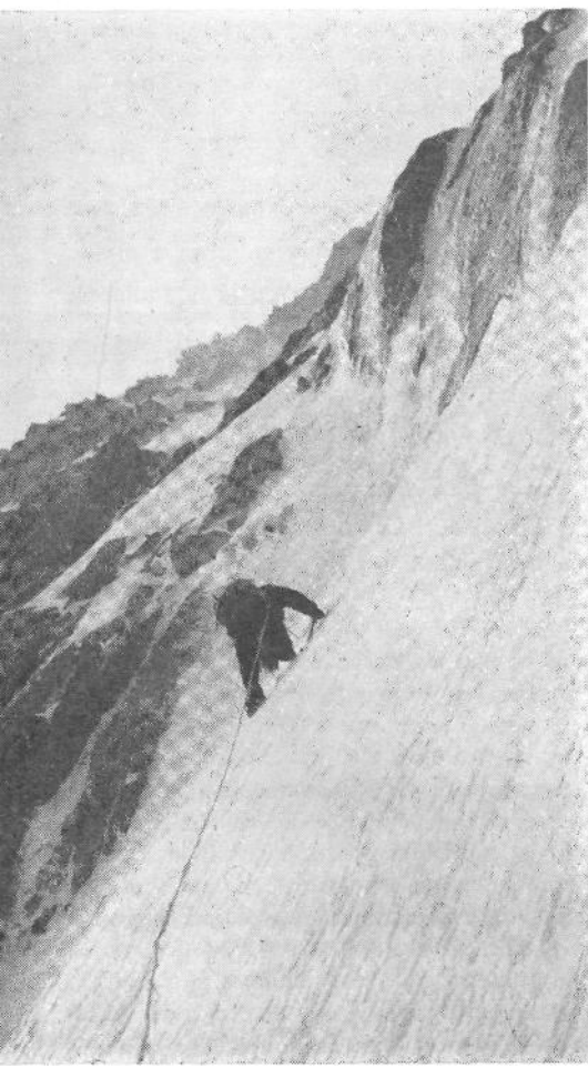
Bližava se ledenemu steburu

Sam sem v dokaj slabi koži. Nekaj po neumnosti pridobljenega pleuritisa mi v zadnji strmini pripravi pravo kalvarijo. Svoj živ dan si ne bi bil mislil, da se bom nekoč tako turoben privlekel na vrh Evrope.