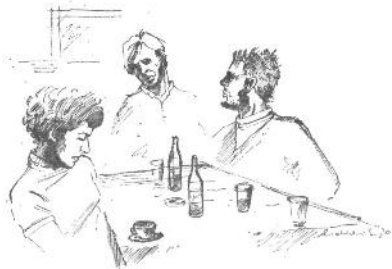
»Kaj misliš o Planji?« Narisal D. Cedilnik

trdnjavi. Prisojnik ga prekaša s svojimi strmimi, zelenimi pobočji. Preko grebenov se Jalovec spogleduje s Planjo, postaven in vabljev. Gotovo so mu dali tako ime iz gole zavisti.