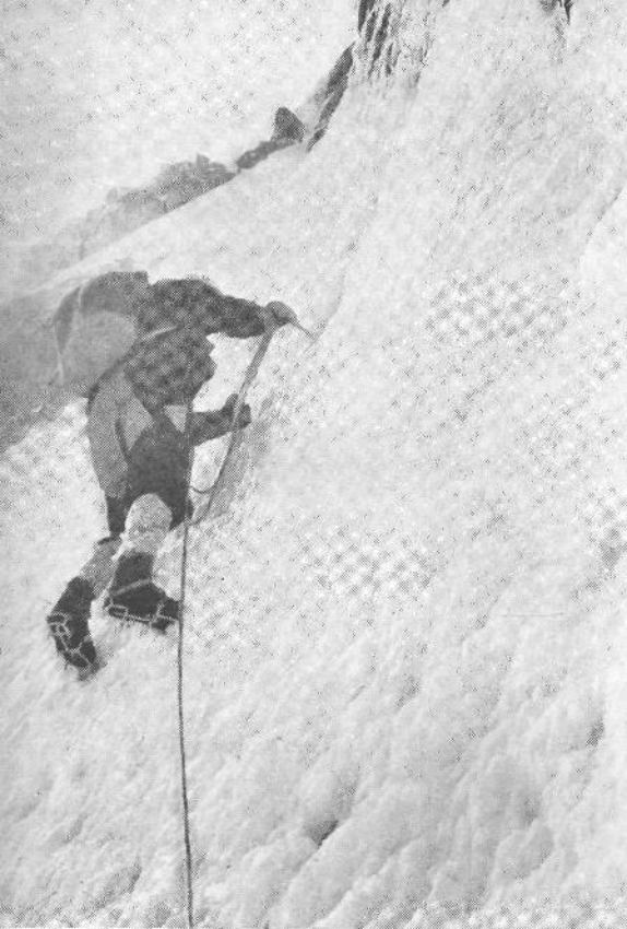
Boro mojstrsko zdela ključno mesto