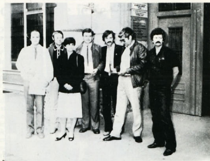
Skupina avtorjev, ki je prejela I. nagrado Inovator Celje