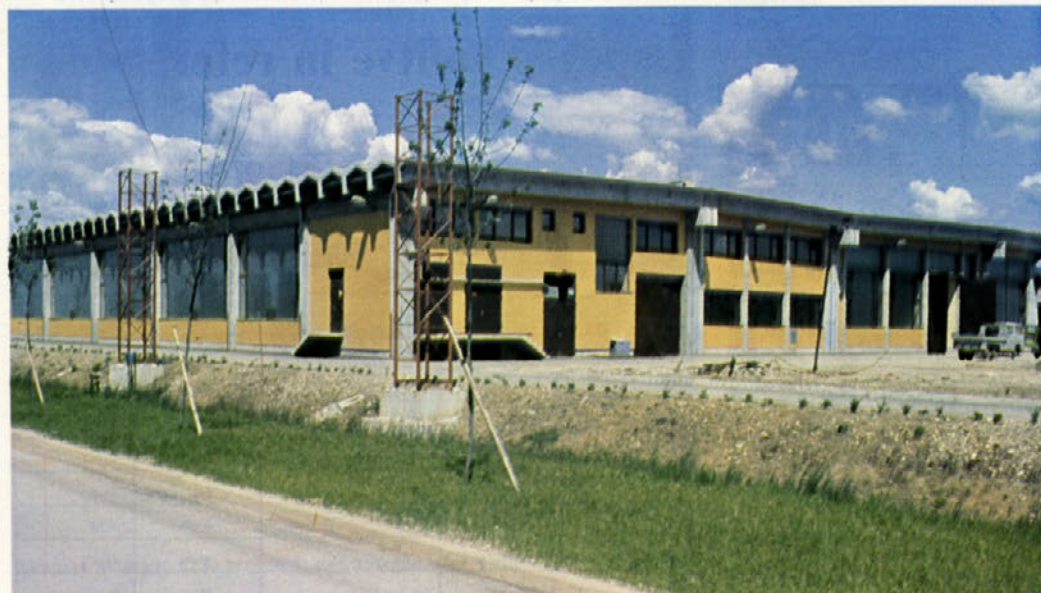
Vzdrževalci so dobili nove sodobne delavniške prostore