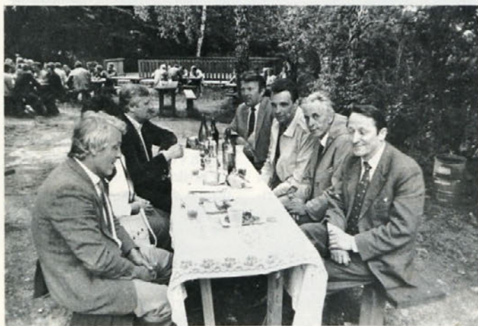
V sredo, 19. junija je sindikat tozda Vzdrževanje na Gričku priredil srečanje vzdrževalcev Cinkarne in delavcev Metalne, na katerem so bili tudi najvišji predstavniki obeh DO.

30. 6. 1985 je potekala dosejanja pogodba z Metalno in je bila ponovno podpisana za dobo 6. mesecev s povečanjem cene na uro za 43 odstotkov.