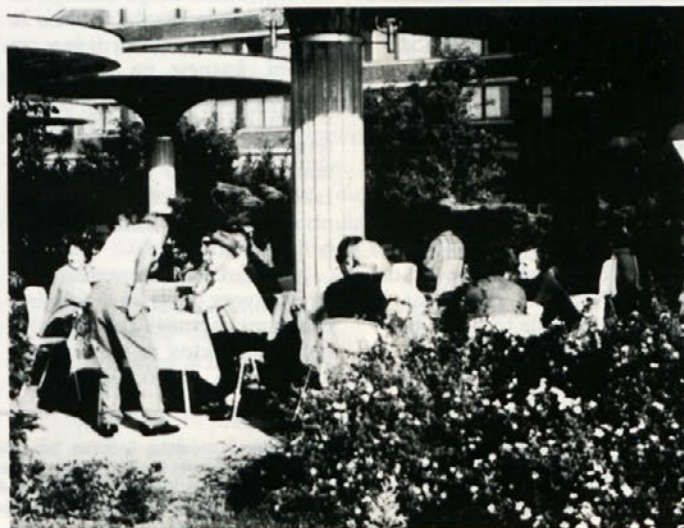
Prosto popoldne v Moravskih toplicah