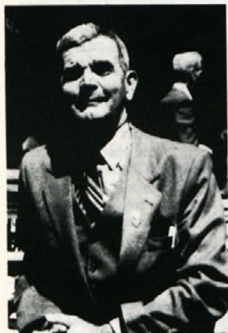
Tudi po 32 letih dela v toplinici in 15 letih upokojitve ostaneš vedrega duha, če znaš živeti kakor Pergamož