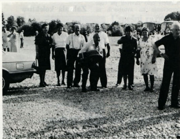
Kmetec zna narediti prijetno razpoloženje