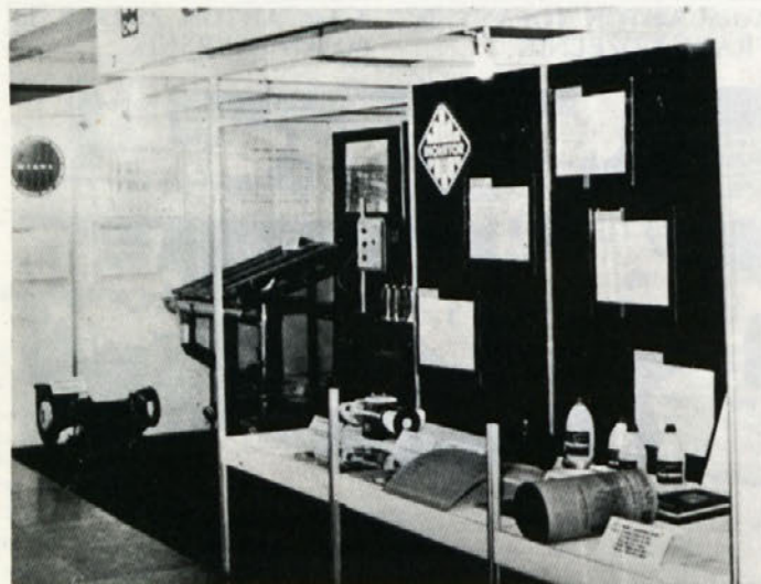
Razstavljeni eksponati Cinkarne na RAST YU