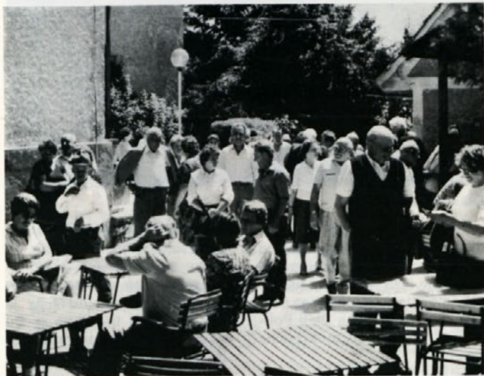
Posnetek v Jeruzalemu