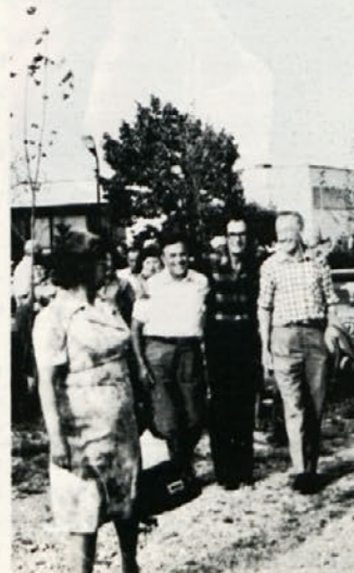
Pred odhodom iz Moravskih toplic