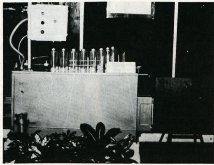
Inovacijski predlog - naprava za pakiranje razredčila za tiskarske barve