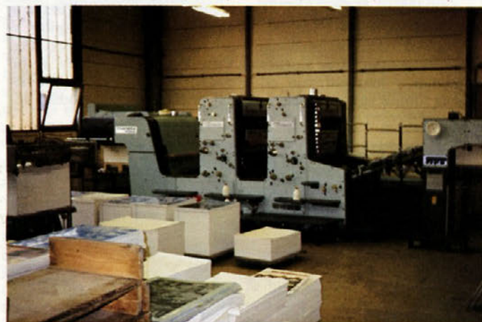
Tiskarski stroj Planeta

je že amortizirana, zato je nov stroj tudi nadomestil obstoječo opremo oziroma jo dopolnil. Z nakupom tega stroja se v tiskarni kompletirajo stroji enega proizvajalca, to je firma Web Poligraf iz Nemške demokratične republike.