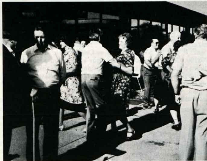
Ob zvokih Kmetčeve harmonike so se tudi veselo zavrteli