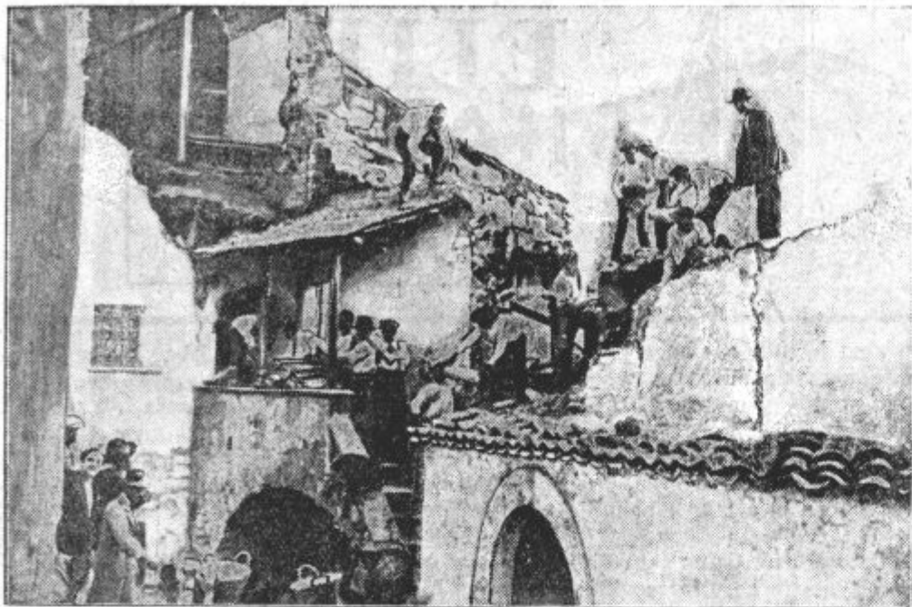
V Italiji popravljajo po potresu porušene hiše. Naša slika kaže popravljanje hiš v mestecu Villanuova, ki ga je bil zadnji veliki potres skoro popolnoma porušil.