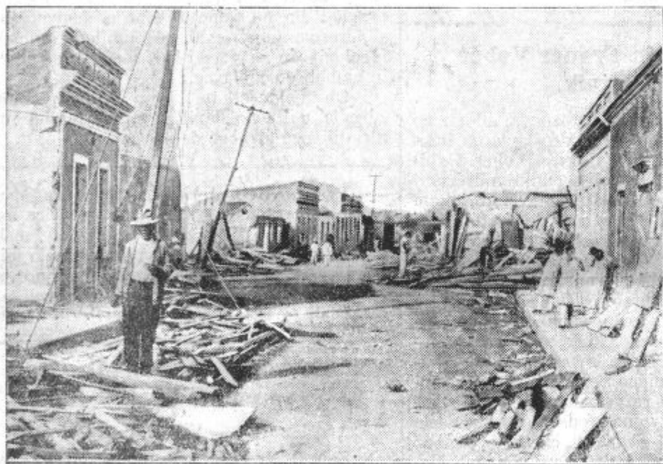
Razdejanja viharja v San Domingu.

Slika nam kaže glavno ulico mesta San Domingo, glavnega mesta istoimenske države na otoku Haiti, ki jo je opustošil vihar. Vihar je porušil okrog 9000 hiš in pokopal pod razvalinami 4000 ljudi.