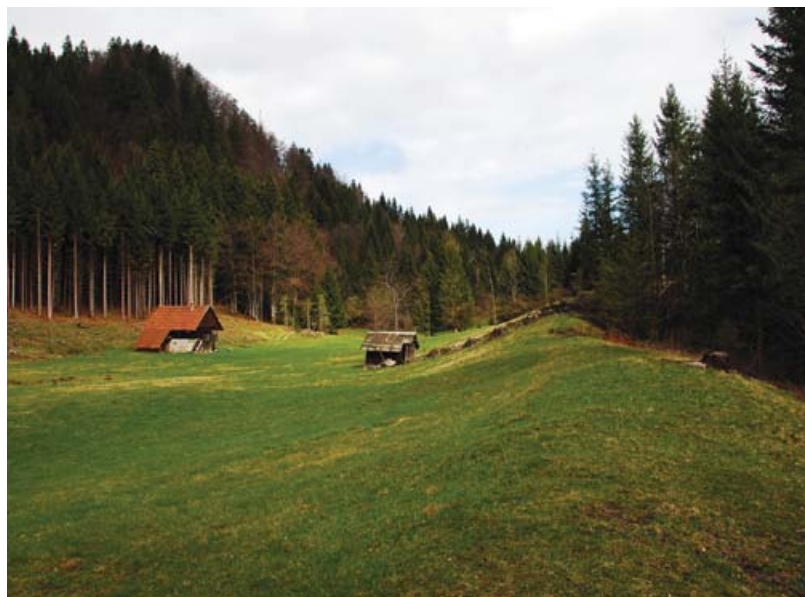
Slika 2: Bočni morenski nasip Bohinjskega ledenika na območju planine Slamniki.

Lega Slovenije na stiku velikih evropskih naravnogeografskih makroregij ter njeno razgibano in dinamično površje sta dva osnovna razloga, ki sta v preteklosti človeku predstavljala glavno oviro pri poselitvi in pri razvoju različnih dejavnosti. Poznavanje sprememb podnebja, razvoja površja in posledično hidrografske mreže ter rabe tal na eni strani ter poznavanje razvoja poselitve in človekovih dejavnosti na drugi strani omogoča razumevanje odvisnosti človeka od pogojev v geografskem okolju, hkrati pa odkriva načine njegovega prilagajanja spremembam v okolju. Niz preteklih klimatskih anomalij in dinamike razvoja površja je dober indikator klimatskih dinamik in nasploh preoblikovanja naravnega okolja Slovenije v prihodnosti. Prav pogled v prihodnost v obliki scenarijev prilagajanja in načrtovanja človekovih dejavnosti je dodana vrednost potekajočega projekta.