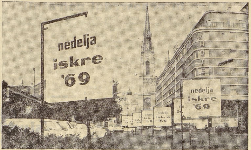
Središče Novega Sada je bilo v času »Tedna ISKRE« v zastavah in panojih, ki so prebivalstvo povsod opozarjali na prireditve v okviru »Tedna ISKRE«

Propaganda je odlično opravila zaupano delo, natanko po načrtu in sorazmerno v kratkem roku. Njej pritiče glavna zasluga za odli-