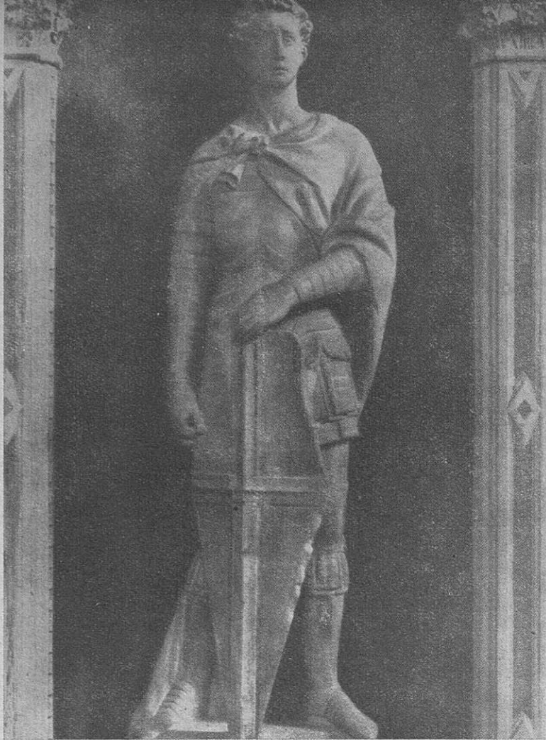
Firenze — Il San Giorgio di Donatello