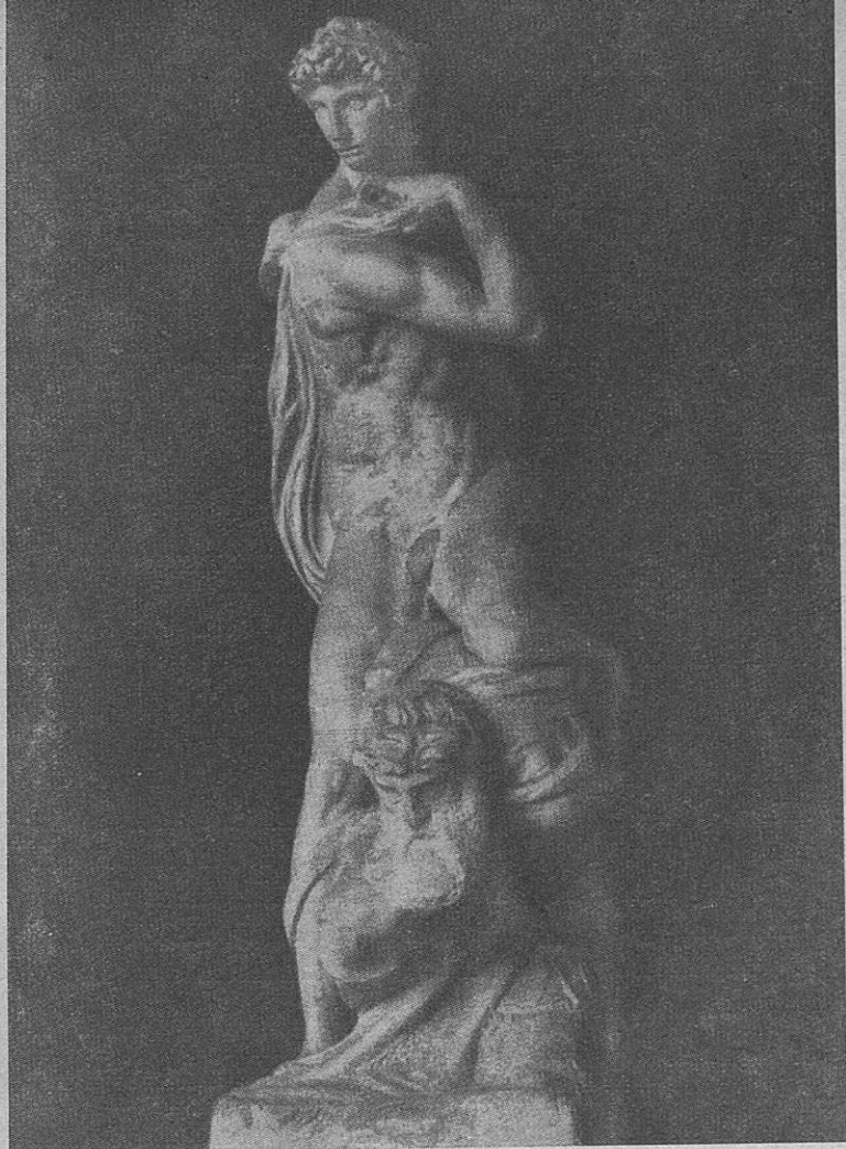
Firenze — La Vittoria di Michelangelo

Simbol mostu, oprt na dve kulturni središči prve veličine, predočuje idejo sodelovanja in razčiščenja odnosov narodov nove Evrope. Most vedno le veže nasproti ležeče