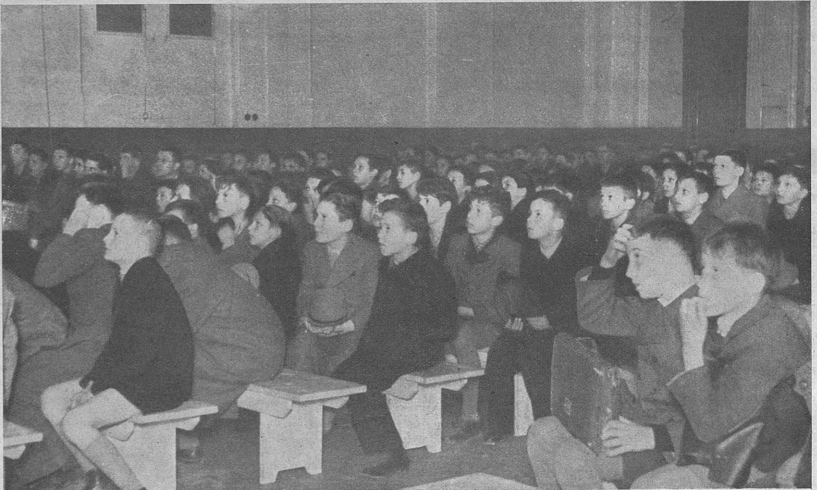
Proiezione cinematografica alla G. I. L. L.

Tudi v tem mesecu se je izvedlo več zdravstvenih ukrepov.