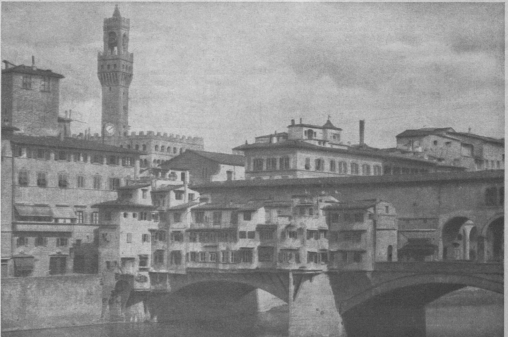
Firenze — Ponte Vecchio

Il simbolo del ponte, fondato su due centri di cultura, diremo di prima grandezza, rende evidente l'idea della collaborazione e della chiarificazione tra i popoli della