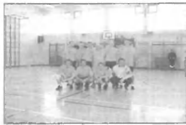
Ekipa Pekos je že pred začetkom prve tekme napovedovala naskok na najvišja mesta