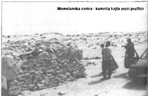
Mawletanska carina - kamnita bajta sredi pustlnji

Zadnji kos poti do glavnega mesta je potekal neposredno po peščeni obmorski obali. To je bila edina možna pot, po njej pa se je dalo potovati samo takrat, ko je nastopila oseka. Približno sto petdeset kilometrov smo tako prevozili z dvema gumama v morju in dvema gumama v pesku. Na eni strani morje, na drugi strani peščene sipine, področje, kjer puščava prehaja v morje. Kaj takega človek ne doživi vsak dan. Bilo je kot v sanjah. Tako kot ponavadi nas je večina popotnikov sedela na strehi našega Klativiteza in uživala v neposrednem stiku z naravnimi lepotami. Na ta način smo puščavo in sploh vs naravo doživljali veliko intenzivne in bolj doživeto. Imela sem občutek, kot da sem del okolja, da se zlijam z njim. Razgled je bil čudovit. Pesek, morje, ptice, ki se zaganjajo v vodo, da bi nalovile kaj za v kljun, delfini v daljavi, ribiške vasice ob obali in ribiči, ki nam mahajo v pozdrav