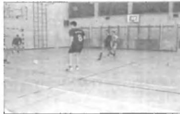
Pod silovitim pritiskom ekipe Trzina je klonila tudi California

Po končanem turnirju so se na račun organizacije turnirja z vseh strani vsule številne pohvale in čestitke, nekaj članov organizacijskega odbora pa je zaradi obilnega in neprestanega trepljanja po ramenih dobilo podpludbe in so morali poiskati pomoč na urgentnem bloku KC Ljubljana.