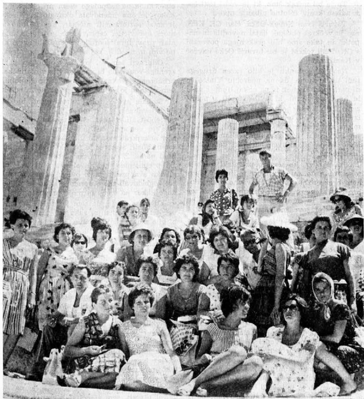
Koprske maturantke na Akropoli (Atene). V ozadju ruševine Partenona

Ko smo bili v Grčiji, smo videli mnogo lepega, toda ko smo pluli zopet ob naši obali, smo videli, da je pri nas najlepše in da mnogo-krat ne znamo ceniti vsega, kar imamo.