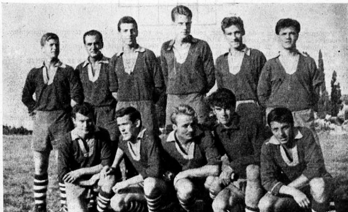
Prva enajstovica NK »Delamaris«

Kljub vsestranskim dokazom, da je pravica na naši strani in da je druga odločitev nepravilna, ni nič zaleglo. Vedeli smo — zakaj. Nekateri so hoteli izsiliti, da bi NK Tomos prevzel prvo mesto, kar pa mu kljub temu ni uspelo.