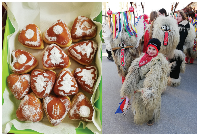
Utrinki iz pustne povorke

smo v petek 25.02. poskrbeli, da so otroke v OŠ in vrtcu Vitomarci obiskali koranti iz društva Vinicius. Otroci iz OŠ in vrtca so korante pričakali maskirani, tako kot je to vsako leto tradicija, in jih je tako pustno rajanje pripravilo na teden počitnic. Vrtcu Vitomarci je Občina podarila še krofe s katerimi so se naši najmlajši lahko posladkali.