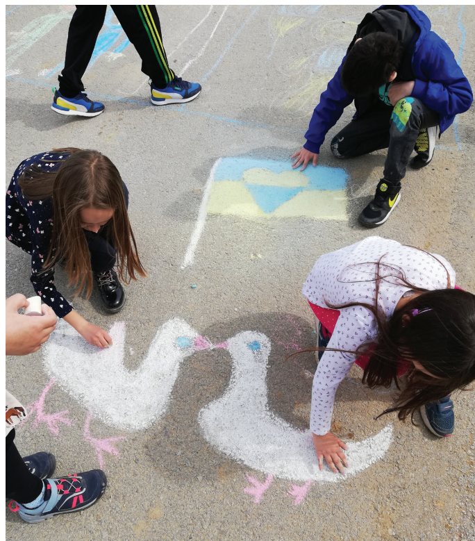
Otroci med ustvarjanjem

Kje drugje, kot po »Poti strpnosti« v Vitomarcih bi bilo bolj primerno, da otroci uporabijo vso svojo domišljijo in naredijo številne čudovite kredne umetnine predvsem v modro – rumeni barvi, vse v podporo Ukrajini. Ustvarjali so otroci iz Vrtca Vitomarci s svojimi vzgojiteljicami, kakor tudi učenci iz Podružnične osnovne šole Vitomarci pod vodstvom svojih učiteljev. Z otroki je ustvarjala tudi županja, saj je prav na pobudo Občine nastal ta čudovit ustvarjalni dan. »Strpnost je ena od kreposti, ki se je učimo in jo negujemo vse življenje. Tudi ta pot je nekaj let nazaj nastala z namenom, da nas na to opominja. S tem dogodkom smo želeli dati jasno sporočilo, da je v teh časih strpnost še kako potrebna, predvsem pa smo želeli s skromno gesto predati sporočilo otrok, da si želijo miru po vsem svetu«, je povedala županja.