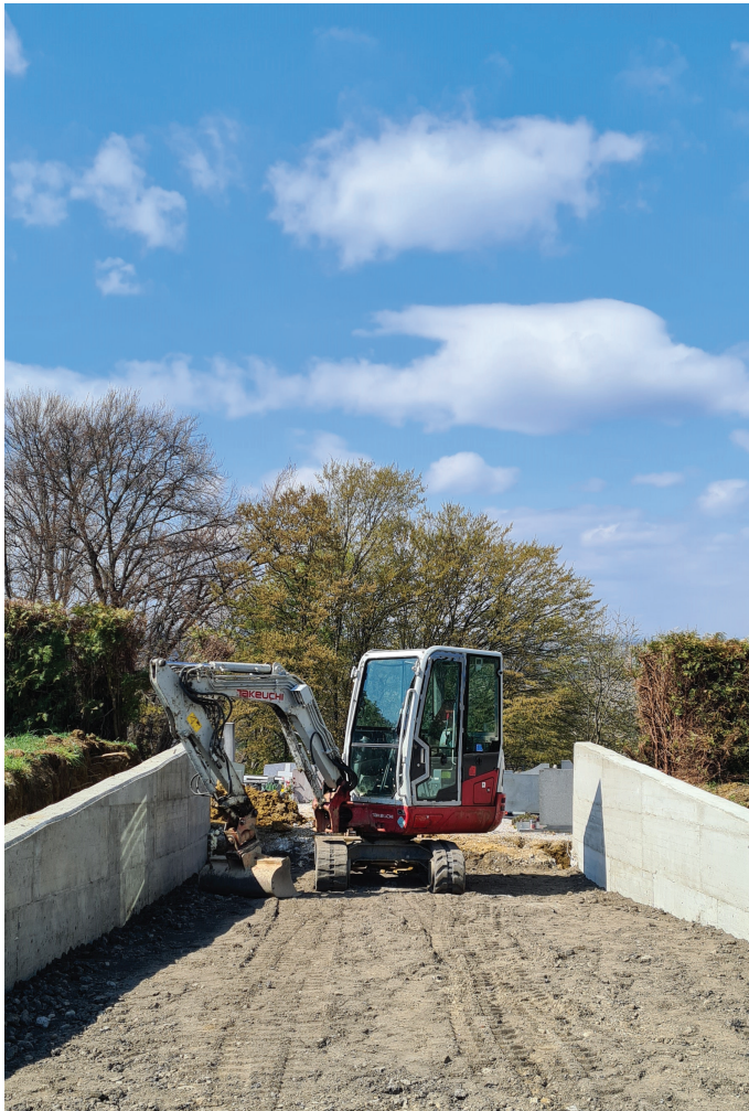
Urejanje dostopa do pokopališča

Zaradi pomanjkanja parkirišč v centru občine, predvsem za potrebe pokopališča, je bilo zgrajeno parkirišče z 19 parkirnimi mesti. Urejen bo neposreden dostop iz parkirišča do pokopališča, ki je že v nastajanju. Želimo, da omenjeno parkirišče čez teden postane glavno za potrebe pokopališča in vežice, saj želimo razbremeniti parkirišča ob občinski stavbi za potrebe zdravnika, občine in pošte.