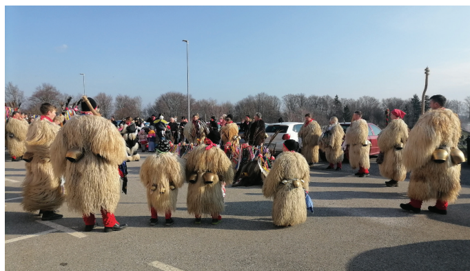
Koranti v Vitomarcih