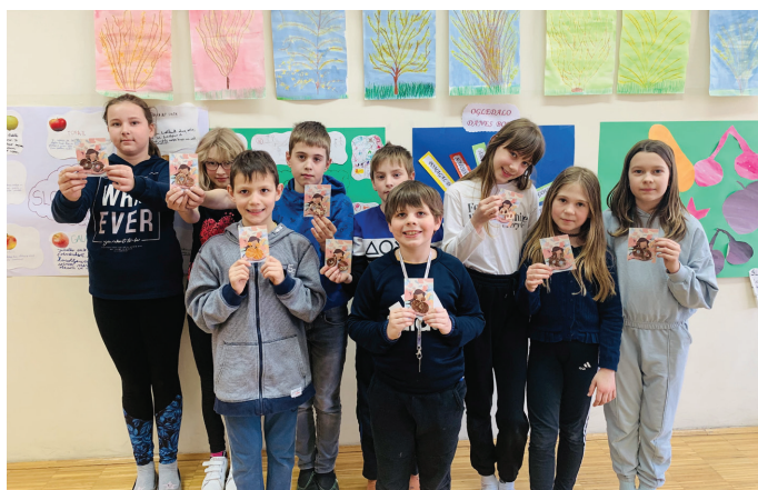
Uhani za mamice