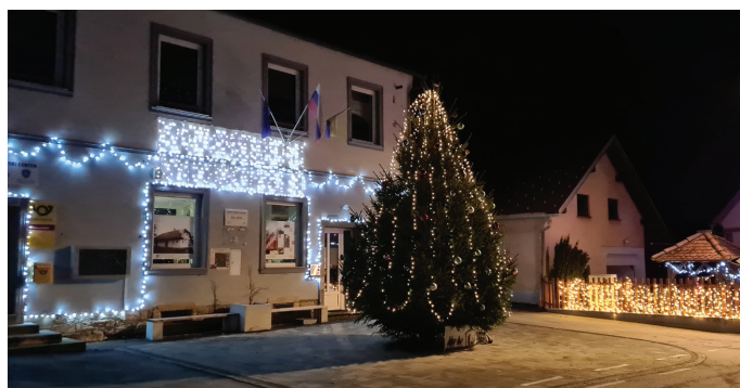
Božično drevo pred občinsko stavbo