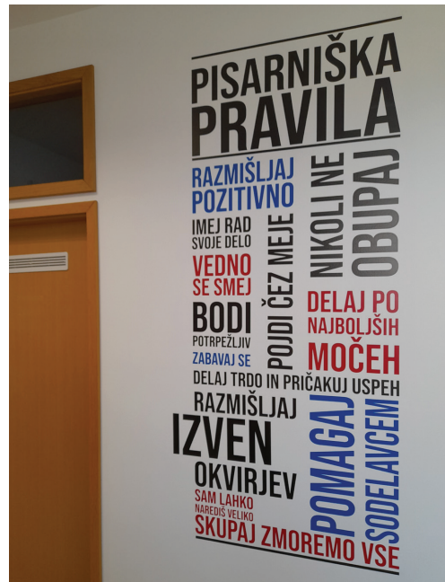
Prenova občinskih prostorov

V mesecu januarju 2022 smo se na Občini lotili obnove Občinskih prostorov. Dela so zajemala brušenje in lakiranje parketov in pleskanje prostorov, kjer deluje občinska uprava in Ambulanta Vitomarci. Pred pleskanjem smo uredili in namestili novo električno napeljavo. Rekonstruirano je bilo računalniško omrežje, električno omrežje in omrežje za protivlomno varovanje. V tem času smo tudi posodobili pisarniško opremo in uredili prostore.