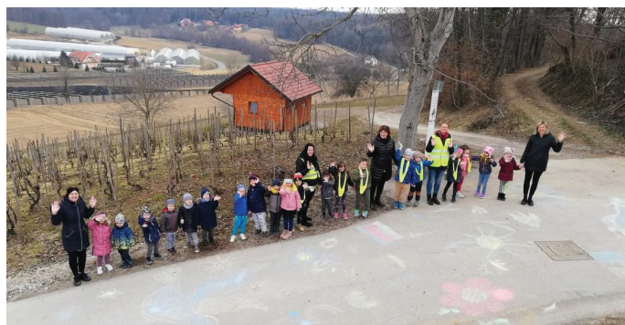
Risanje po poti strpnosti s kredami v znak solidarnosti vojne v Ukrajini