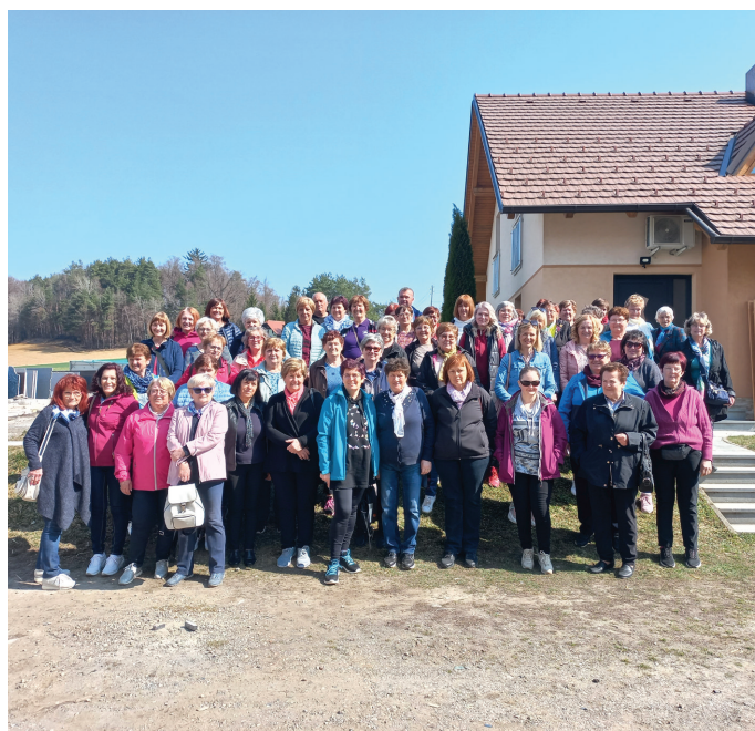
Vitomarške gospodinje na izletu

26. 3. 2022 smo se popeljale na strokovno ekskurzijo, ki jo je organizirala Izletniška kmetija Šenveter - na Dražen vrhu, kjer so nas po dobrodošlici postregli s kmečkim zajtrkom. V Zgornjem Dražen vrhu v občini Šentilj smo si ogledali muzej in galerijo v Methansovi hiši. Nato smo se odpeljali v Zgornjo Konjišče na Apaško polje, kjer so našli ob mrtvem rokavu reke Mure ostanek ogromnega drevesa - hrasta. Sledil je ogled mejnega prehoda na reki Muri. Brod na Muri predstavlja pomembno prometno povezavo med Avstrijo in Slovenijo in je namenjen za turistične prevoze. Na Zgornji Velki smo si ogledali cerkev Marije Snežne, od tam smo se odpeljali nazaj na Izletniško kmetijo Šenveter na bogato kmečko kosilo, nato pa proti domu.