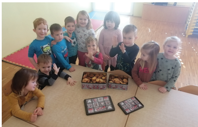
Spekli smo lastne piškote za mamice