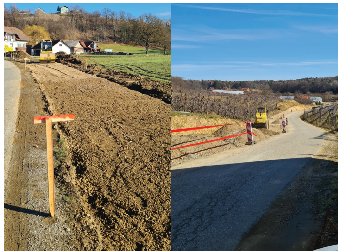
Gradnja kolesarskih poti

Kot lahko spremljate, je gradnja kolesarskih poti v polnem teku. V tem času je bila večina trase zakoličena, izvedeni so bili vsi izkopi zemljišč s spodnjim ustrojem, urejeno je bilo odvodnjavanje, izvedeni so bili oporni zidovi in večina navoza zgornjega ustroja. V nadaljevanju bo urejen še zaključni del odvodnjavanja, položitev robnikov in izvedba asfaltne prevleke s horizontalno in vertikalno signalizacijo. V izgradnji je tudi šest mostov, ki bodo zaključeni v mesecu aprilu. Mostovi so zgrajeni tako, da bomo v slučaju potrebe po rekonstrukciji obstoječih mostov, uredili preusmeritev prometa na kolesarske mostove.