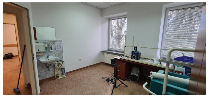
Prenova zdravstvenih prostorov

V mesecu januarju 2022 smo se na Občini lotili obnove Občinskih prostorov. Dela so zajemala brušenje in lakiranje parketov in pleskanje prostorov, kjer deluje občinska uprava in Ambulanta Vitomarci. Pred pleskanjem smo uredili in namestili novo električno napeljavo. Rekonstruirano je bilo računalniško omrežje, električno omrežje in omrežje za protivlomno varovanje. V tem času smo tudi posodobili pisarniško opremo in uredili prostore.