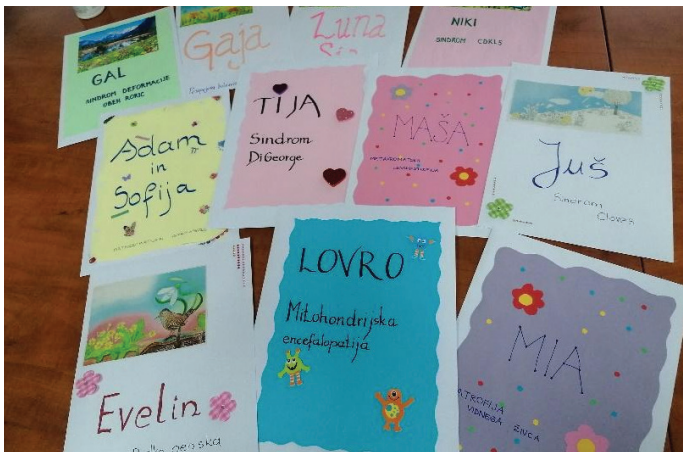
Pisma malim borcem

kimi boleznimi. Zgodbe teh otrok so nas močno ganile.