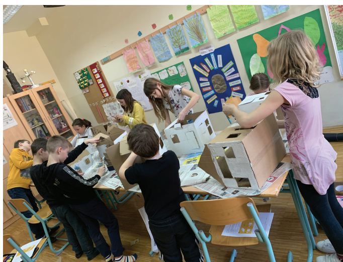
Hiške iz kartona