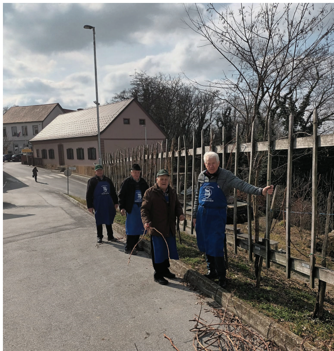
Viničarji na delu