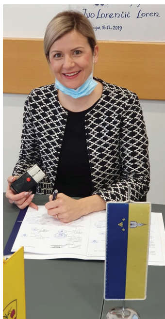
Županja med podpisom pogodbe

24-urna dežurna pogrebna služba obsega vsak prevoz od kraja smrti do hladilnih prostorov izvajalca javne službe ali zdravstvenega zavoda zaradi obdukcije pokojnika, odvzema organov oziroma drugih postopkov na pokojniku in nato do hladilnih prostorov izvajalca javne službe, vključno