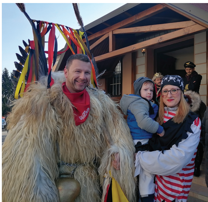
Povorka v Vitomarcih

Zbrali smo se ob 9. uri, kjer so pred našo cerkvijo najprej zaplesali koranti iz Kulturnega društva Rogoznica in iz Društva Vinicius Vitomarci. Skupaj jih je bilo okoli trideset. Zatem pa je pisana pustna povorka živahno krenila preko centra našega lepega kraja do Večnamenske dvorane Vitomarci, kjer je bila pogostitev s krofi s krajšim veselim druženjem.