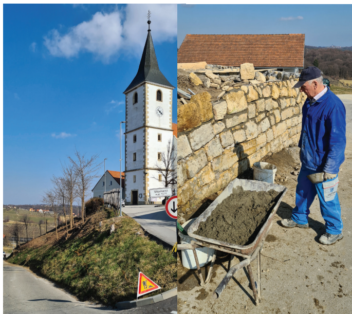
Dela v okolici cerkve

kralj ubogih. Ko so osla privedli k Jezusu, so učenci položili na žrebe svoja oblačila in »nanj posadili Jezusa«. »Ko se je že bližal pobočju Oljske gore, je začela vsa množica učencev z močnim glasom veselo hvaliti Boga za vse čudeže, ki so jih videli. Govorili so: 'Blagoslovljen, ki prihaja, kralj, v Gospodovem imenu!' Mir v nebesih in slava na višavah!« Ljudje so torej počastili Jezusa, ki prihaja v imenu Gospodovem; počastili so pričakovanega Mesija, ki prinaša mir in odrešenje s križem. Na poti k jeruzalemskemu templju se Jezus ni ustavil v templju, gre naprej proti zadnjemu cilju in se vzpne na križ, na znamenje kraljestva miru in žrtve ter setve za drugega.