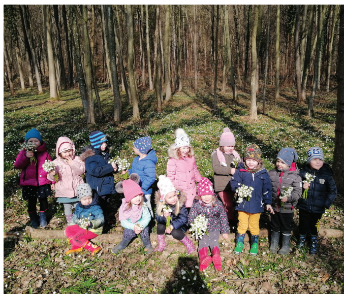
Zvončki za mamice