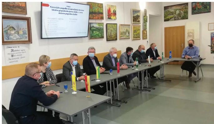
Župani osrednjega dela Slovenskih goric

Občine Lenart v Slovenskih goricah, Cerkvenjak, Benedikt, Sveta Ana, Sveta Trojica v Slovenskih goricah, Sveti Jurij v Slovenskih goricah, Destrnik, Sveti Andraž v Slovenskih goricah in Trnovska vas so objavile skupni javni razpis po postopku konkurenčnega dialoga za podelitev koncesije za opravljanje lokalne gospodarske javne službe 24 urne dežurne pogrebne službe na njihovem območju.