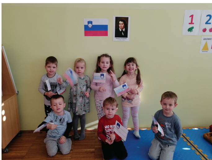
Ob slovenskem kulturnem prazniku smo si izdelali slovenske zastave