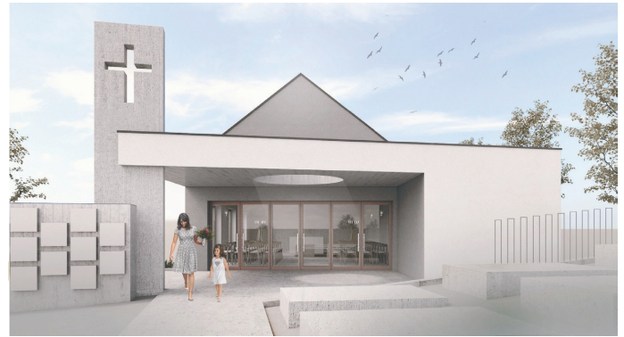
Vizualizacija nove vežice

Dovozna pot je že sedaj načrtovana na način, da bo skladna z bodočim projektom novega sakralno kulturnega objekta za katerega smo v fazi pridobivanja gradbenega dovoljenja, ki ga bomo pridobili v letošnjem letu.