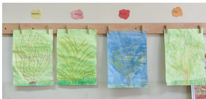
Pomlad v razredu