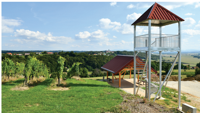
Razgledni stolp na Ostragovi