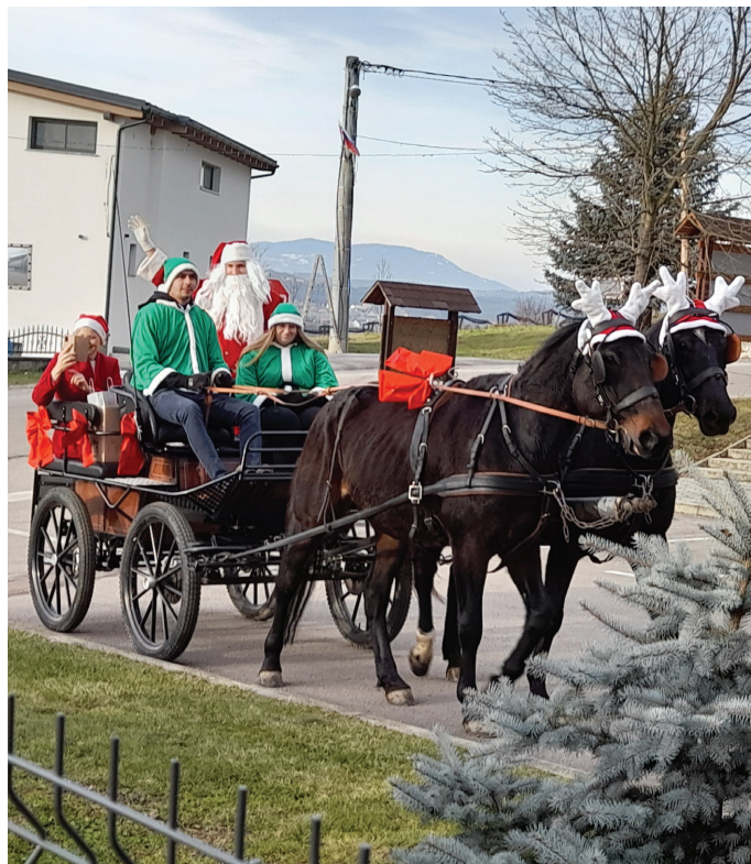
Vitomarški božiček s spremstvom