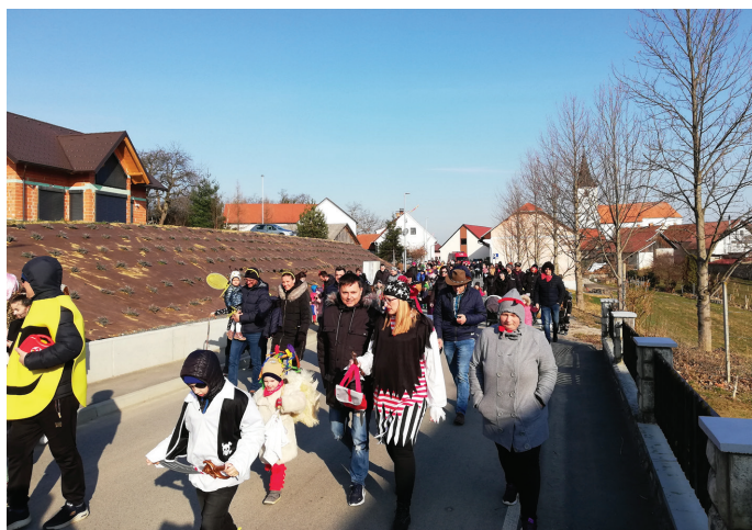
Pustna povorka v Vitomarcih

V nedeljo 27.02. pa smo imeli pravo pustno povorko, ki jo je otvorilo društvo korantov Vinicius iz Kulturnega društva Rogoznica. V spremstvu PGD Vitomarci in množice obiskovalcev v različnih maskah, smo se sprehodili od cerkve Sv. Andraža do večnamenske dvorane, kjer je naše društvo gospodinj Vitomarci pripravilo čudovite domače krofe in kranjske klobase, vinogradniško društvo je poskrbelo za pijačo, KUD Vitomarci pa je poskrbelo za splošno organizacijo dogodka. Tudi vreme nam je služilo in tako se je po, kar se nam zdi, že zelo dolgem času, pustno rajanje spet vrnilo v Sv. Andraž.