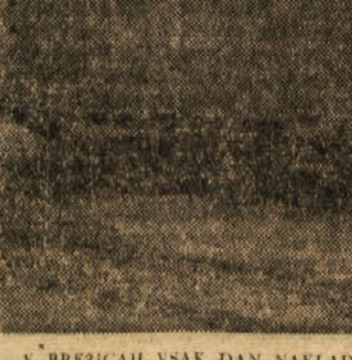
V BREŽICAH VSAK DAN NAKLADAJO NA VAGONE PREMORG IZ RUDNIKA GLOBOKO. RAVNO TA PREVOZ IZ GLOBOKEGA DO BREŽIC IN NAKLADANJE PA PREČEJ DRAZI GLOBOKI PREMORG

Prireditve bodo v veliki dvorani doma TVD »Partizan« v Zagorju s pričetkom ob 19. uri. Vstopnice pa lahko kupite v predprodaji v knjigarni v Zagorju.