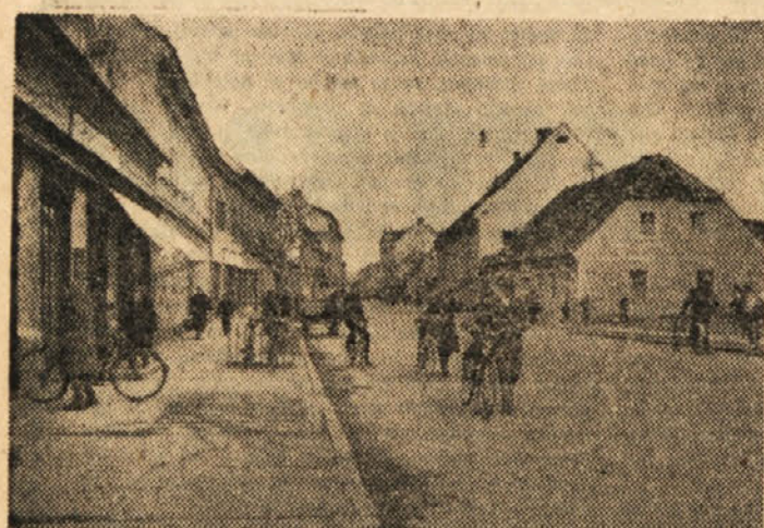
MOTIV IZ BREŽIC