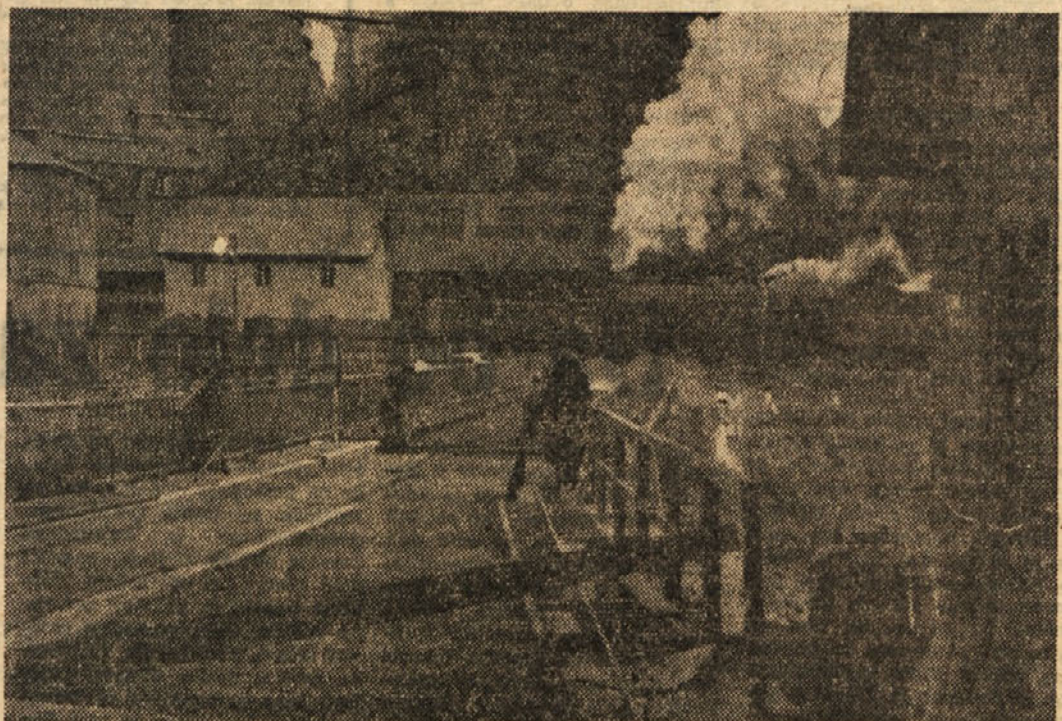
TE DNI SO KONČNO LE ODPRLI OBNOVLJEN MOST ČEZ SAVO V TRBOVLJAH

kaj sredstev pa je ostalo rudniku še iz lanskega leta. S tem denarjem namerava rudnik graditi dva stanovanjska bloka, v katerih bo 72 stanovanj, nadalje občinski ljudski odbor, Industrija grabenega materiala, Ind. rudarska šola, Elektro Tr-