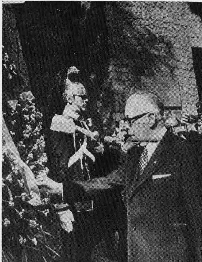
Nemški predsednik Heinemann se klanja spomenu talcev v Ardeatinskih jamah

Zahodnonemški kancler Brandt je po veleposlaniku v Moskvi povabil sovjetskega prvaka Brežnjeva na obisk v Bonn. S tem bo tajnik sovjetske KP vrnil obisk nemškemu kanclerju, ki je bil pred dvema letoma na Krimu. Poročajo tudi, da bo šel letos poleti Brežnjeve na uradni obisk v Washington in s tem vrnil obisk amerškemu predsedniku. Ni še znano, če bosta z Brežnjevim prišla v ZDA tudi Podgorni in Kosigin.