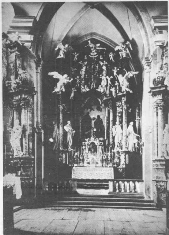
Glavni oltar v nekdanji minoritski cerkvi

»Sedemstopenetdeset let mineva, odkar so Frančiškovi sinovi prišli na Ptuj, sinovi tistega Frančiška, ki že skozi stoletja velja za enega najbolj globokih duhov, preprost v svoji zunanjsčini in delovanju, toda bogat po svojem