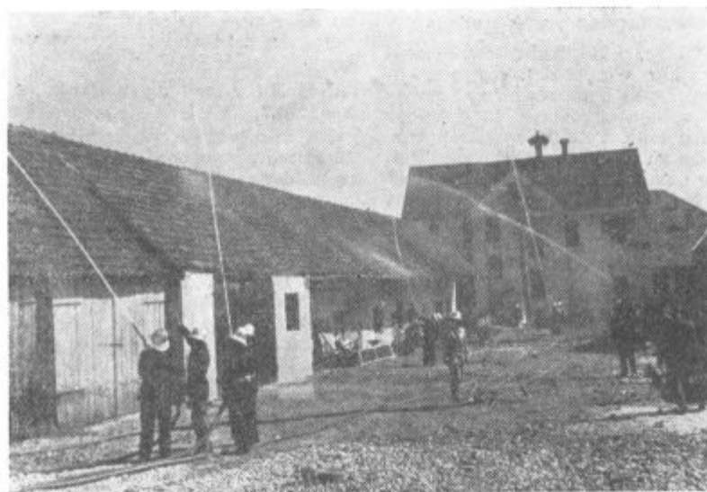
Strokovna usposobljenost gasilcev je nedvomno osnovni pogoj za hitro in uspešno intervencijo pri požarih. Deloma je moč tako sposobnost doseči s prirejanjem manevrov. Na sliki: Gasilski manever v Lenartu.