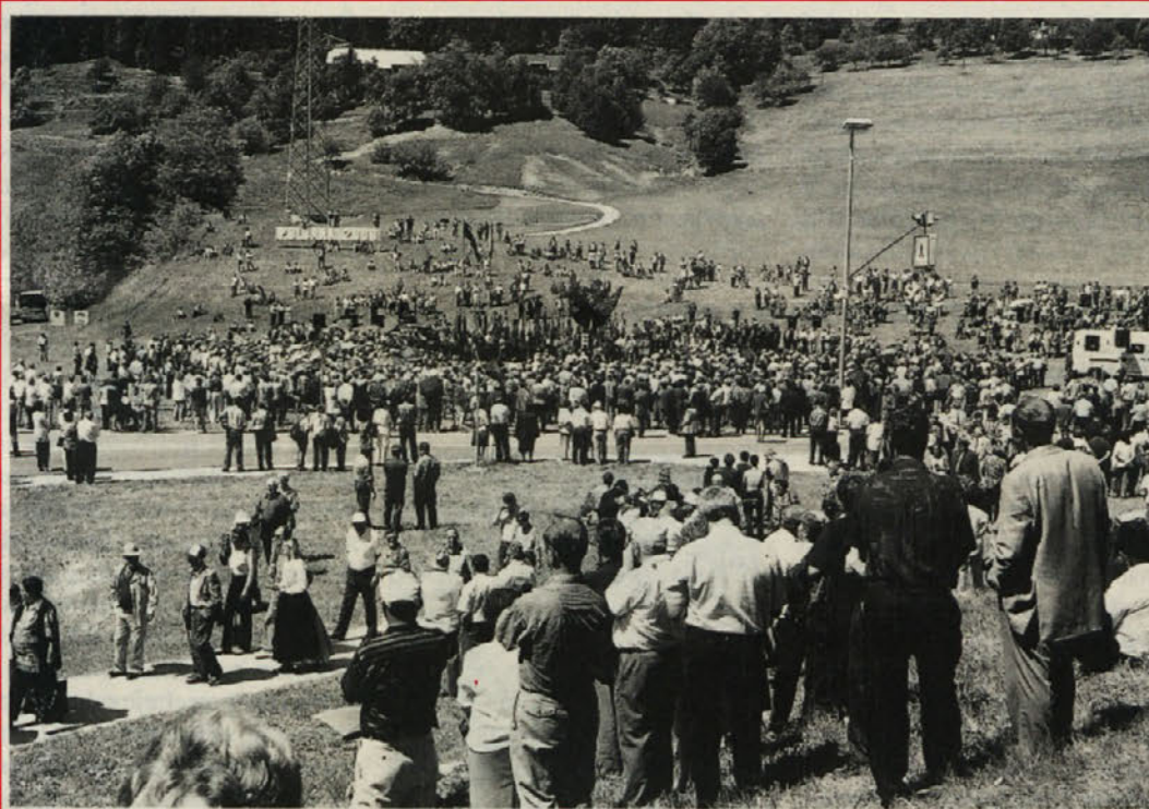
Na Poljani pri Prevaljah je bila v nedeljo svečanost ob 55. obletnici zadnjih bojev z nacisti na evropskih tleh. Izredno množične prireditve, katere slavnostni govornik je bil predsednik Republike Slovenije Milan Kučan, so se udeležili tudi predstavniki Zveze koroških partizanov. Več na 2. strani