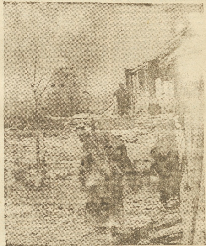
Po strašni borbi se je umaknil sovražnik

Kmalu se nam je ponudila prilika. Naš bataljon je dobil nalogo, da li-