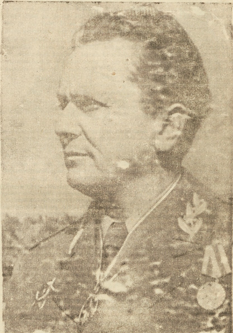
Vrhovni komandant naših oboroženih sil maršal Tito

Ja silna moč preroda naših narodov, ki so tako brez vsakega truma trdno verovali v zmago pravične vojne, leži v nerazrušljivi povezanosti vojske in zaledja, kapti vojska in zaledje sta bila ena sama strujena oblika boričih se ljudskih množic, prav za prav ena sama fronta, kjer je vse sodelovalo za dosego istega cilja. Oborožena vojska je tolkla okupatorja in ga uničevala na vsakem koraku, četirila je vasi in osvobodjene pokrajine zaledje pa je to vojsko hranilo, negovalo, ji ločilo rane in utrjevalo v osvobojenih krajih pridobitve njenih zmag. Zlasti pa je krepilo to verovanje v zmago, ki priti mora, vedno bolj iz krvi rastoče bratstvo in enotnost vseh narodov Jugoslavije — tista največja pridobitev naših narodov, katere zagon in