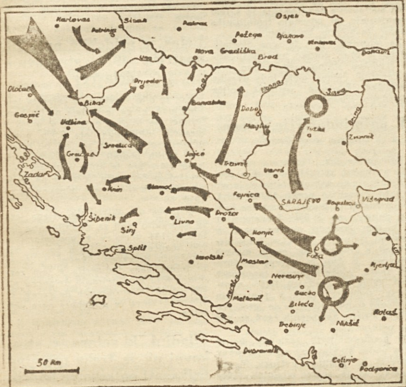
Ofenziva proletarske brigade konec pomladi 1942 proti Bosanski Krajini

imele izgube, kar je v zvezi z dogodki v Srbiji posebno izkoriščala reakcija v Črni gori za svojo izdajalsko propagando in načrte.