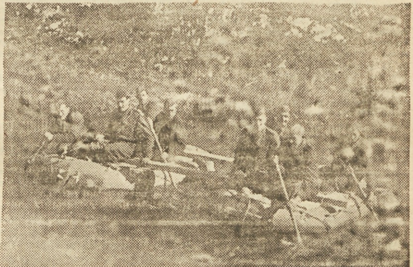
Na pohodu čez reko

smisel sta povzročala v borbi največje uspehe — tista največja pridobitev, na kateri danes rase moč in sila nove, Titove Jugoslavije. Toda ves naš odpor in vse naše žrtve bi bile zaman, če bi ne črpala naša vojska svojih neustrašenih sklepov in podtrgov iz globlin največjih težav ljudskega človeka, ki mu jih je Partija zapisala na zastavo, ko ga je povedla v to naravno človeško borbo. Partija je imela or-