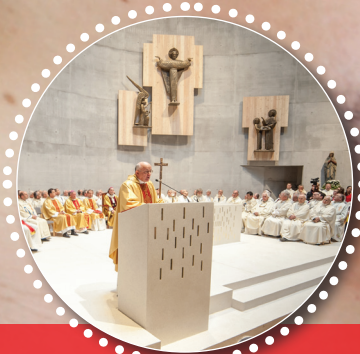
SVETIŠČE V MARIBORU