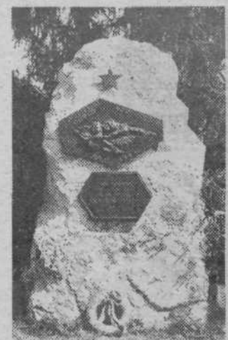
Obeležje Dolenjskemu odredu