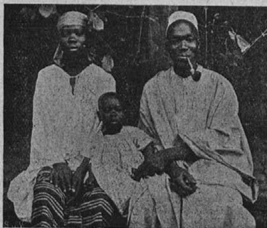
Krščanska zamorska družina v Bamako.

Vem, da sem vse sprejel, kar ste zame poslali. Zahvaljujem se Vam za to darilo. Prosim Boga, naj Vas pri Vašem blagem delovanju blagoslavlja. Doma sem iz Foubama. Ničesar