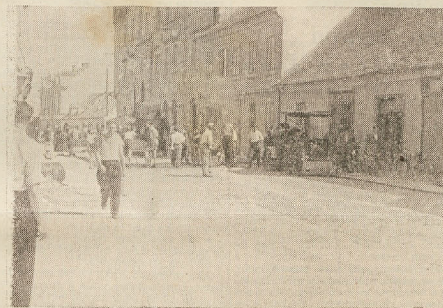
Frontovci v Brežicah si urejujejo glavno ulico