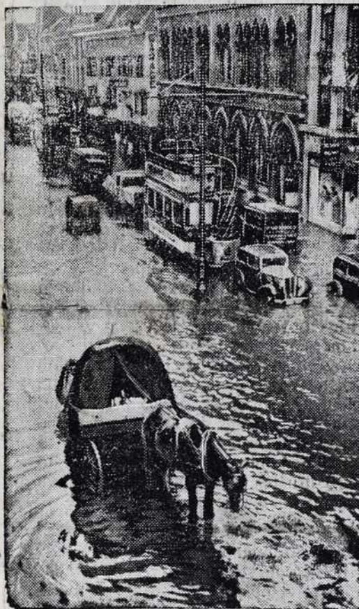
Velka povoden je bila na Angleškem, tak da je po mestnih vulicaj voda stala pol metra visiko. Na sliki vidimo mesto Bristol pod vodov.

Naša inteligenca na Slomškovih dnevaj v Maribori. Zadnjič smo omenili, keliko duhovnikov je hodilo iz Slov. krajine v Maribor na Slomškove osetke. Zdaj pa povemo, da je bila zastopana tudi inteligenca,