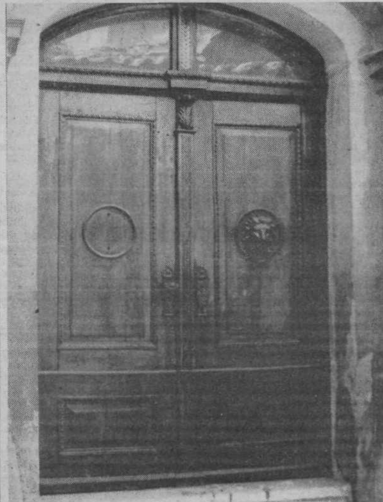
Tudi levo krilo vhodnih vrat v mestni muzej v Gosposki ulici je krasila levja glava, dokler je ni ukradel strastni zbiralec ali pa objestneži!