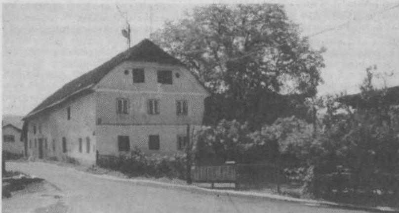
Hiša Jožeta Jamnika z letnico 1824, kjer naj bi po domnevi bil koseški dvorec

Kot je mogoče razbrati iz zgodovinskega pregleda, je imel Kašelj kaj pisano družbo lastnikov zemljišč in tlačanov. Lastništvo se je drobilo in znova sestavljalo še naprej, vse do zemljiške odveze leta 1848, ko so kmetje postali lastniki zemlje, na kateri so stoletja delali.