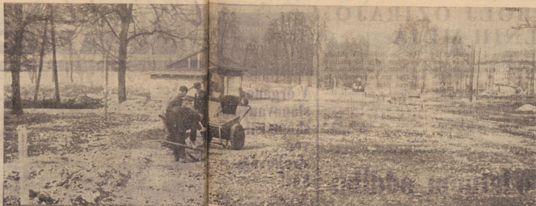
Celovška cesta bočasno sopotnico, po kateri bo tekel mestni promet

...je stanovanje v vsaki vrednosti stanovanj