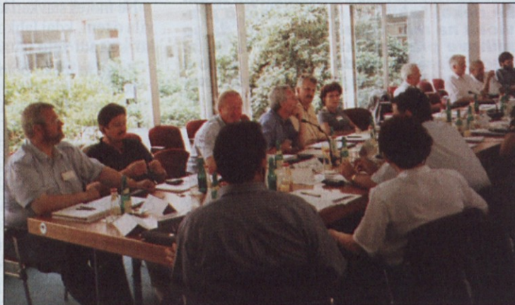
Predstavniki slovenskih sindikatov na konferenci v Bonnu 5. in 6. julija.

– v pripravo in izvajanje nacionalnih regionalnih in strukturnih programov morajo države kandidatke vključiti tudi sindikate, ki bodo v procesih sodelovali skladno s svojo močjo.