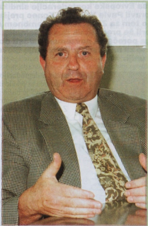
Mnenje, da je v glavnem mestu za delavce le dobro, je napačno