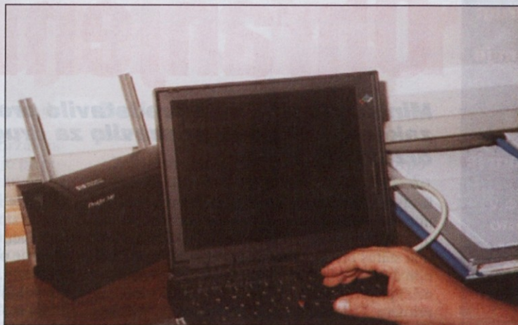
Prenosni notesniki omogočajo sekretarjem, da ob obiskih in pogovorih v podjetjih uporabijo vso datoteko območne organizacije.