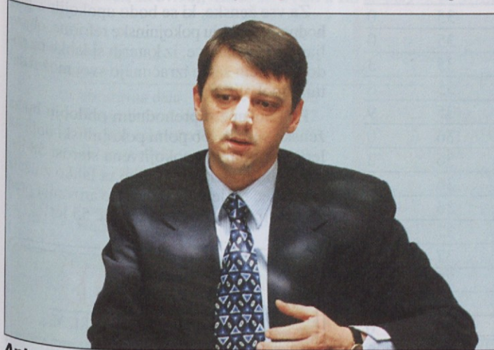
Anton Rop: Upokojenci bodo delili usodo zaposlenih. Če bo šlo delavcem dobro, bo dobro tudi upokojencem, če bo gospodarska kriza, bodo upokojenci delili usodo za zaposlenimi.

no pokojnino naj bi dobili vsi, ki bodo dopolnili 65 let in so med petnajstimi in petinšestdesetim letom najmanj 30 let prebivali v Sloveniji. Dodan pa je (kot je zahteval državni zbor) premoženjski cenzus. Pravice do državne pokojnine ne bodo imeli tisti, ki imajo druge do-