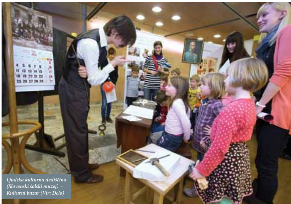
Ljudska kulturna dediščina (Slovenski šolski muzej) - Kulturni bazar

Odnos med kulturno dediščino in izobraževanjem je bil v preteklosti navadno omejen na pasivno obiskovanje in vodene ogledne spomenikov, muzejev ali predmetov. Učenci so v kronološkem vrstnem redu spoznavali dogodke iz preteklosti, ki niso bili povezani z njihovimi življenjskimi izkušnjami. Letaki ali brošure, ki ponujajo informacije o dogodku ali predme-