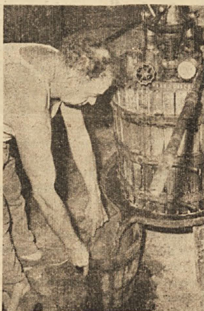
Trgatev je že za nami. Vinogradniki imajo sedaj mnogo dela v kletih, čeprav je zaradi vremenskih nepriklj letošnji pridelek mnogo manjši kot po navadi. Na nekaterih področjih trgatve sploh ni bilo, saj je toča vse uničila, na mnogih področjih pa se je zaradi suše posušilo mnogo trt. Oblasti niso nudile prizadetim podpore

DELO glasilo KPI za slovensko narodno manjšino Izhaja vsak petek Urejuje uredniški odbor Politični direktor: Marija Bernetič - Odgovorni urednik: Anton Mirko Kapelj - Uredništvo in uprava: Trst, ul. Capitolina 3, telef. 44-046/44-047. Tiska: Tipografija Riva - Trst ul. Torrebianca 12. Celoletna naročnina 1300 lir, polletna 700 lir. Poštni tekoči čekovni račun št. 11/7000. Cena oglasov po dogovoru