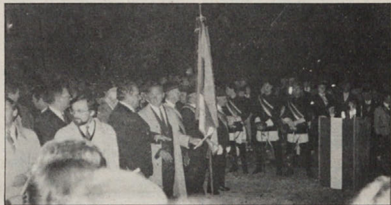
Občina Pliberk tudi letos ni poskrbela za dvojezičnost ob 10. oktobru.