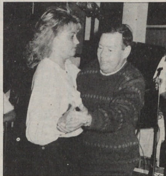
Izvrstno so se zabavali udeleženci lanskoletnega martinovanja. Tudi letos bo poskrbljeno za obilo zabave.

Natančen program bomo objavili prihodnji teden. Že danes pa Vas prisrčno vabimo!