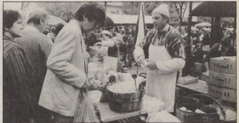
Živilski trg v Ljubljani je dobro založen. O paniki ali drugih zaskrbljujočih pojavih ni bilo ne duha ne sluha.

Glavni krivec za tako sramotni in za sožitje v državi tako dramatični poseg JNA je bivši komandant TO,