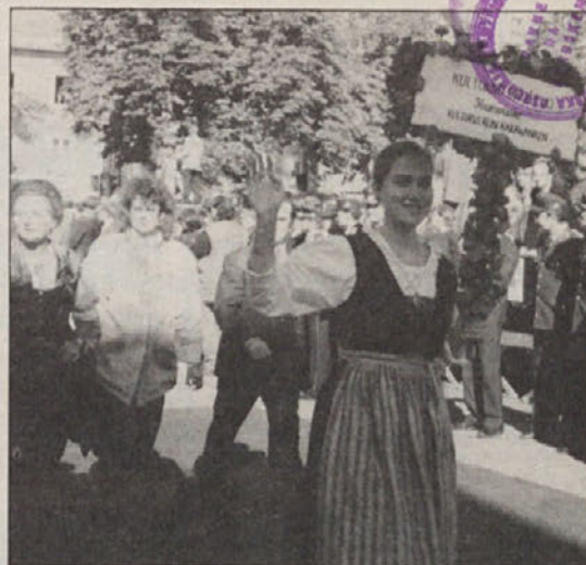
Je že kdo kaj slišal o kulturnem društvu „Karavanke“? 10. oktobra je korakalo v sprevedu, pod imenom Slovensko kulturna društva. To je nesramnost brez primera.

Erscheinungsort Klagenfurt/Izhaja v Celovcu Verlagspostamt 9020 Klagenfurt/Poštni urad 9020 Celovec