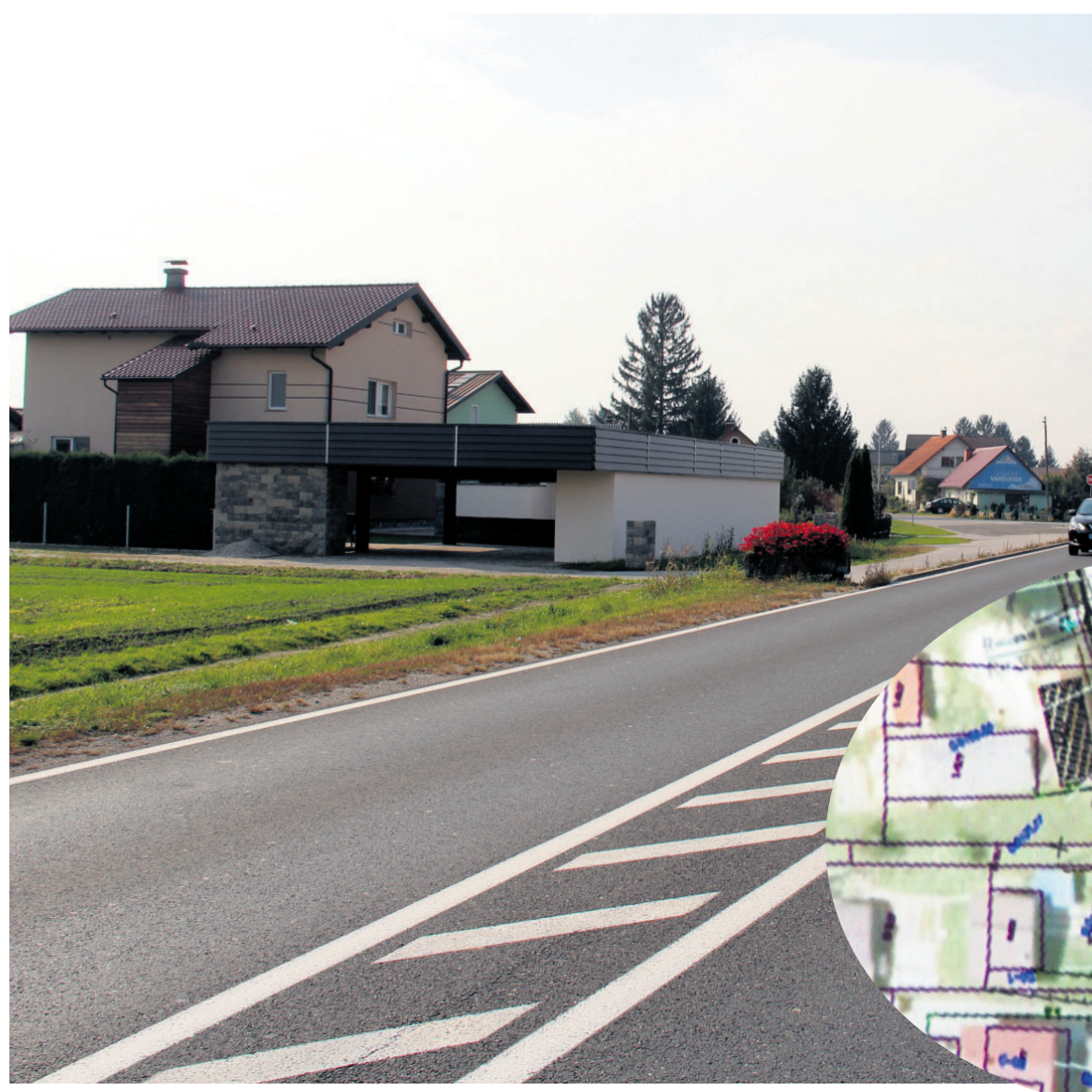
DRSI na mestu današnjega štirikrakega križišča načrtuje križišče.

trov. Pločnik in kolesarska steza se bosta v naselju držala cestišča, izven naselja bosta od ceste ločena z zelenim pasom. Po celotni dolžini bodo zamenjali asfaltno prevleko. Cesta bo po obnovi višja, in sicer od pet do deset centimetrov, kar je med krajani povzročilo precej nejevolje. „Že sedaj so naše parcele nižje od ceste. Potem bo še slabše. Ali bomo potrebovali terence, da bomo lahko