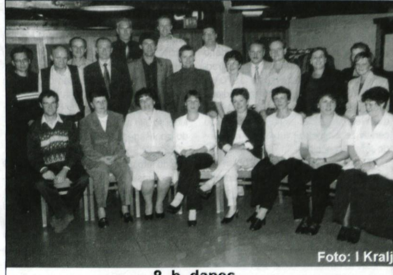
8. b danes