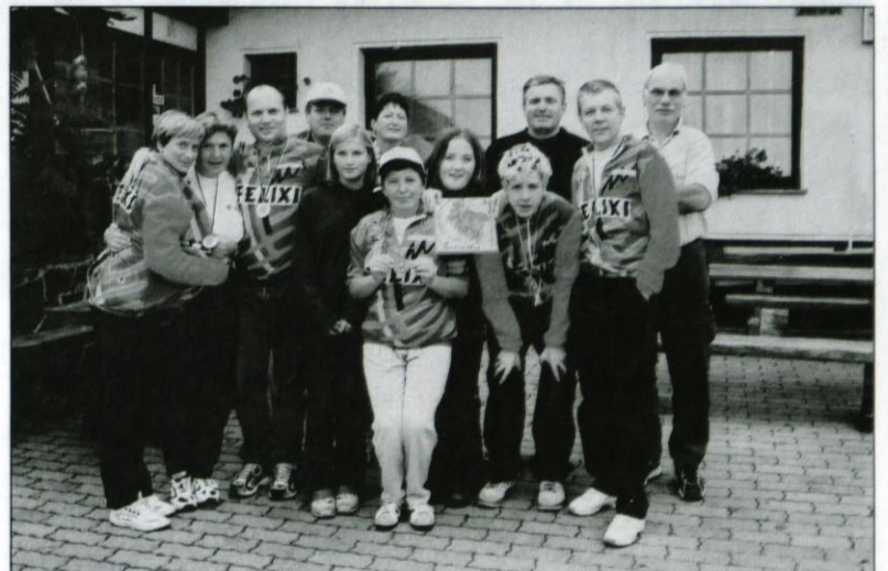
Najštevilčnejša ekipa so bili skupina Felixi iz Trzina.