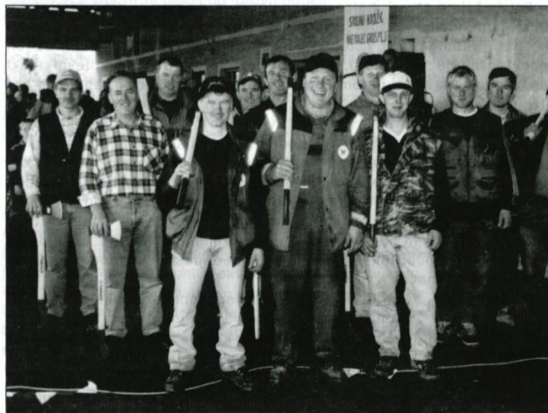
Tekmovalci v gozdarskih večerinah po razglasitvi rezultatov.