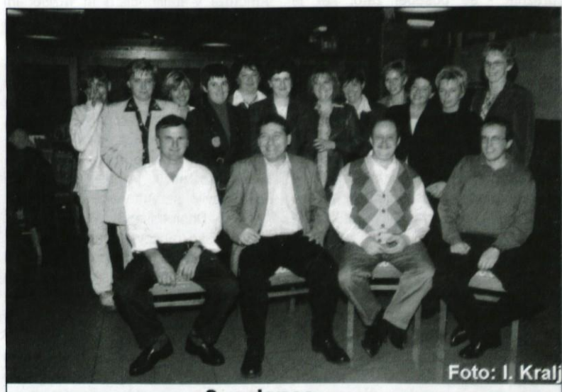
8. c danes