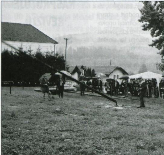
Podiranje debela na balonček.

Boštanj, 23. septembra 2001 - Že šesta tradicionalna predstavitev Strojnega krožka Kmetovalec, ki deluje na območju občin Dobrepolje, Ivančna Gorica in Grosuplje, je bila to pot na posestvu v Boštanju. Tematsko je bila predstavitev namenjena izkoriščanju lesne biomase, ki jo je v naši okolici kar precej. V bodoče bo to pomembna oblika izkoriščanja domačih surovin, ki smo jih v zadnjih letih vse preveč zanemarjali.