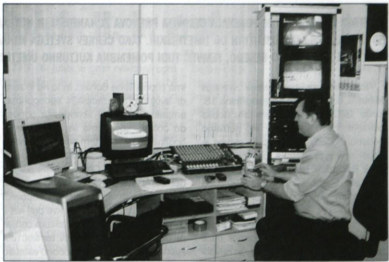
V tehničnem prostoru grosupeljske televizije.

število lokalnih televizij. Je med vami morda določena oblika sodelovanja in povezovanja v smislu dopolnjevanja programa?