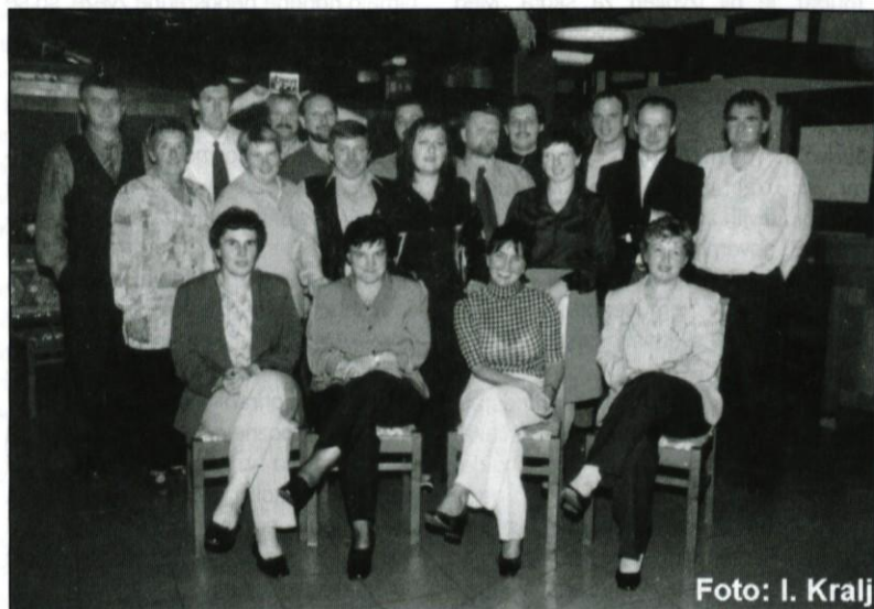
8. d danes