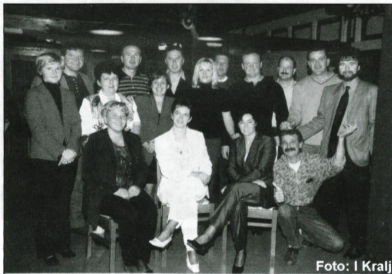
8. a danes

Valeta. Se spomnite kaj naj bi ta beseda pomenila. Se spomnite svojih sošolk in sošolcev? Si želite še kdaj srečati svojo osnovnošolsko