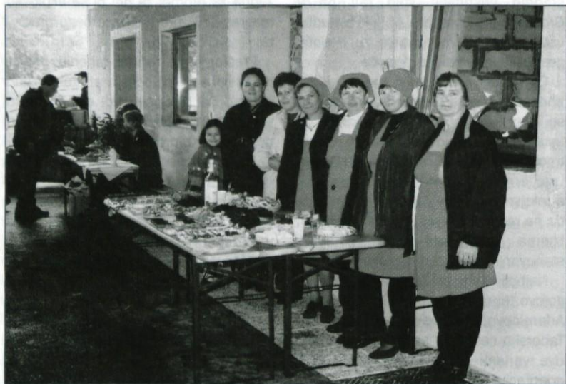
Na predstavitvi je DPŽ Sončnica iz Grosupljega obiskovalce posladkalo z dobrotami.