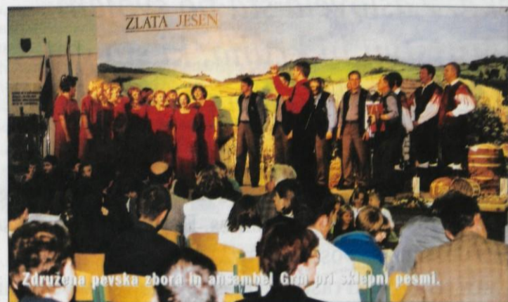
Združena pevška zbor in ansambel GRM pri žegnanju pesmi.