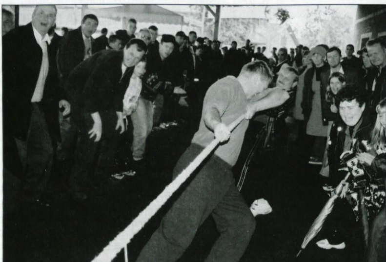
Zmagovalna ekipa iz Dobrepolja je ob bučni podpori navijačev premagala ostali dve ekipi.