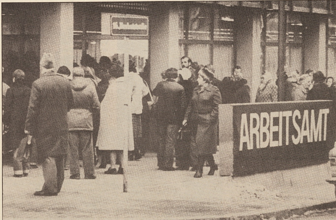
„Arbeitsamt“ — kako dolgo bo mogel ta urad še posredovati dovolj dela?

Živimo v težkih gospodarskih časih. Vedno več podjetij zapira vrata ali znatno zmanjšuje število sodelavcev. Število brezposelnih raste iz dneva v dan — državne oblasti, ki so doslej skušale reševati gospodarske probleme s tem, da so najele visoke dolgove, pa tudi ne vedo, kako in kam. Se približujemo podobnim časom, kot so jih doživeli naši starejši ljudje pred 2. svetovno vojno, ko je bila svetovna gospodarska kriza?