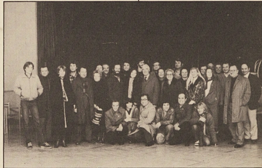
Igralci celjskega gledališča so se po predstavi v Št. Primožu postavili pred aparat našega fotografa.

Celjsko gledališče pa je nastopilo tudi v Št. Primožu in na Slovenski gimnaziji. Več o predstavi „Magnetni deček“ bomo poročali v naslednji številki Našega tednika.