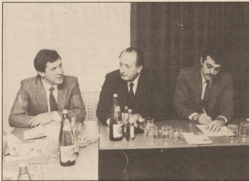
Delegacija SZDL Srbije je 3. 12. obiskala koroške Slovence. O obisku poročamo na drugem mestu.