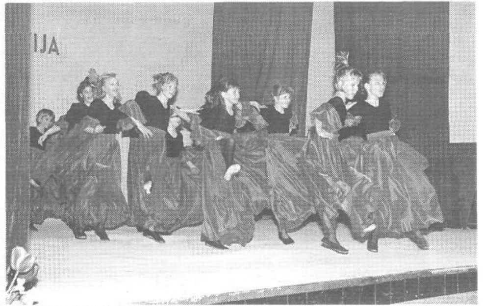
Plesna skupina Ekstrem iz Dobrove se je predstavila z značilnim francoskim kan. kanom.