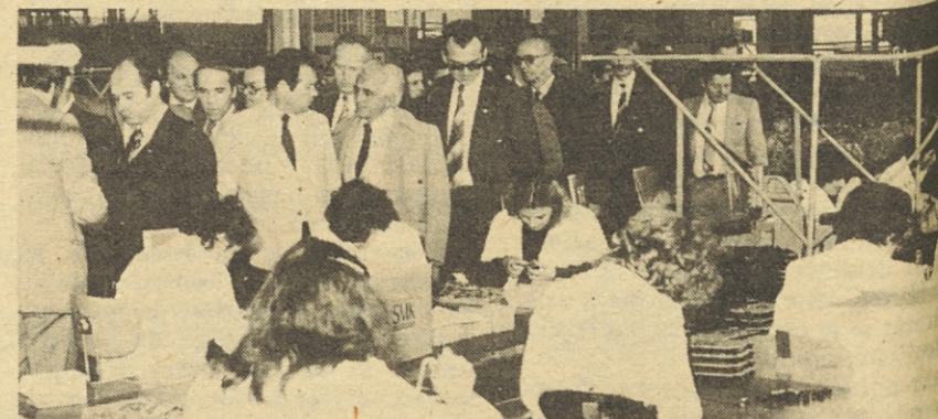
Vodilni predstavniki naše ZT mreže na ogledu proizvodnje v Digitronu.