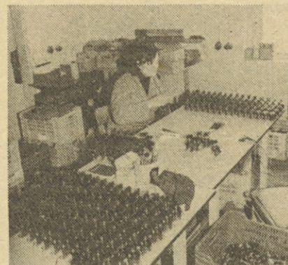
TOZD KEKO: pomemben je tudi dopolnilni program, na sliki: kontrola stikal.