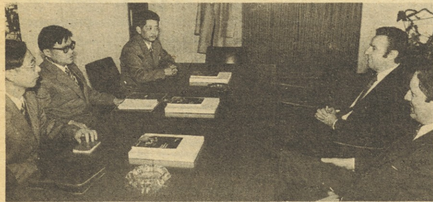
Med pogovori v Industriji elementov.