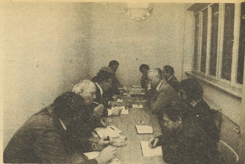
Z delovnega obiska v TOZD Sprejemniki.

Ta sredstva se tudi zelo počasi obračajo zaradi nesortiranosti reprovromaterialov. V takšnem položaju, v kakršnem so, se dogaja še nekaj. Prisiljeni so kupovati reprovromaterial, ki zaposli kar največ delavcev, ne pa takega, ki bi bil dohodkovno najbolj zanimiv. Hkrati ugotavljajo, da ni