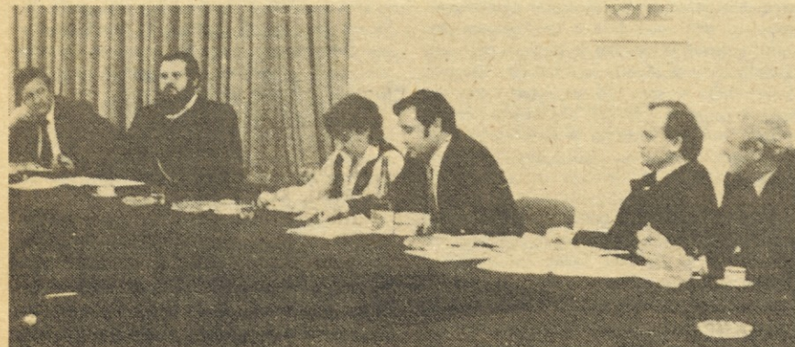
Z delovnega razgovora o združevanju dela in sredstev.

Na kratko bi rezultate delovnega razgovora lahko strnili v naslednje: Kranjska Iskra je na prej opisanih področjih načelno odprta delovna organizacija, kar dokazuje že njena dosedanja aktivnost (na primer trenutno aktualno vlaganje sredstev za razvoj industrije v manj razvitem delu Slovenije, v Prekmurju). Seveda, pa so njene odločitve o sovlaganjih odvisne tudi od ekonomskih zakonitosti. Še posebej ob trenutno zelo zapleteni gospodarski situaciji kranjske Iskre so ekonomska vprašanja še bolj izpostavljena. Kazimir Mohar