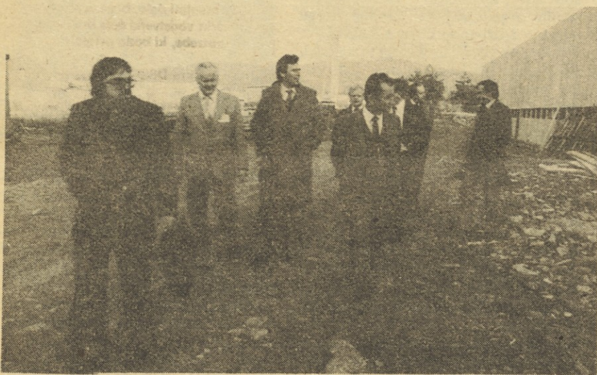
Med ogledom novega poslopja v Sežani.