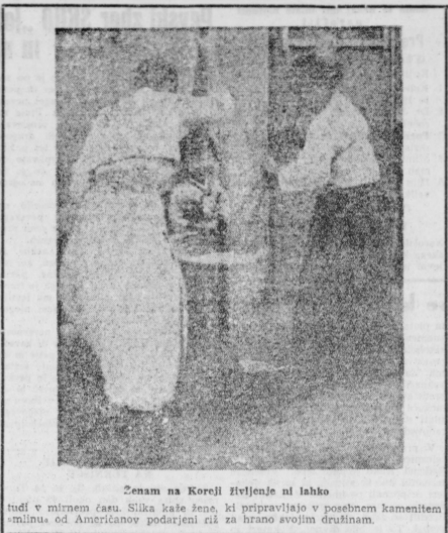
Ženam na Koreji življenje ni lahko

Kdor je pošten in odkritosrčen sam do sebe, je pošten in odkritosrčen tudi do drugih.