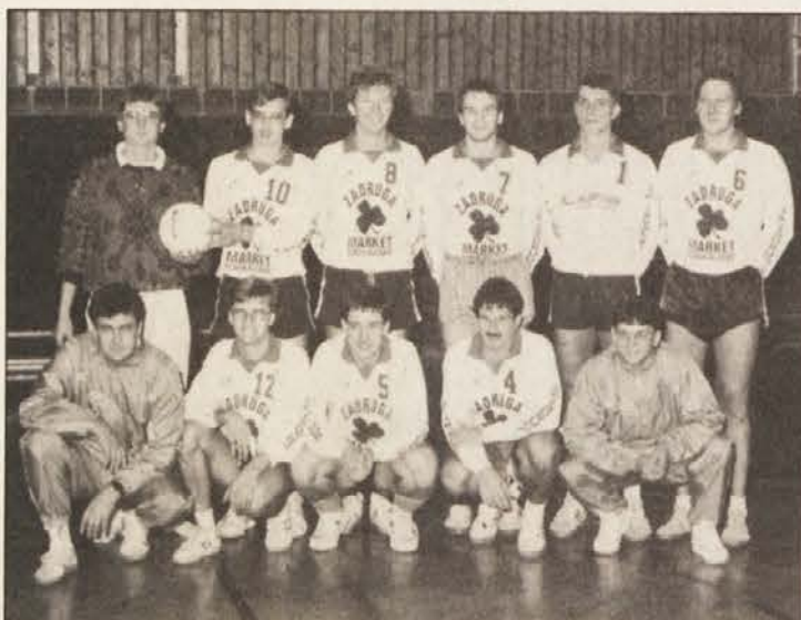
Ekipa ŠK Dob je postala prvak v regionalni ligi-vzhod.

SK Dob/Aich je osvojil naslov prvaka regionalne lige-vzhod z 12 zmagami v 13 tekmah, manjka le še 13. zmagi prihodnjo soboto v tekmah proti Südstadtu.